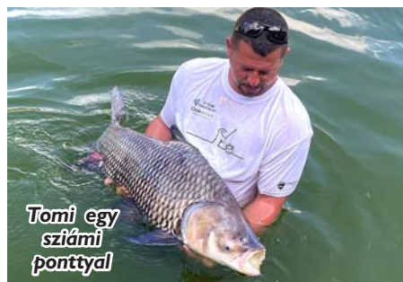
Tomí egy szíami ponttyal

Az elsőnél repülő halakat imitálva hívtuk fel magunkra a halak figyelmét, a csalik pedig tintahalak voltak. Jó pár kört tettünk meg a területen, de igazi