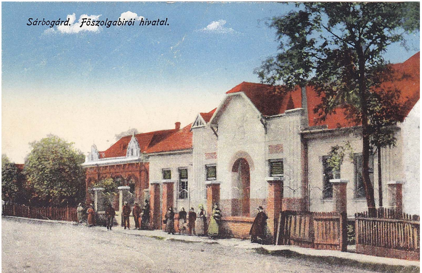
Régen főszolgabírói hivatal, ma rendőrség (kép a túloldalon)