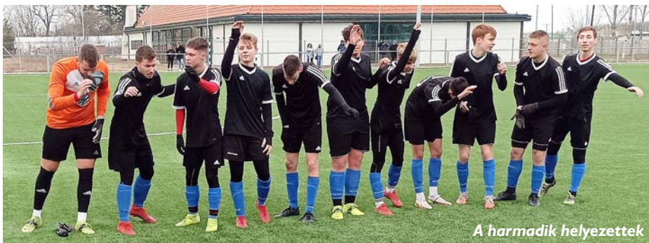
A harmadik helyezettek