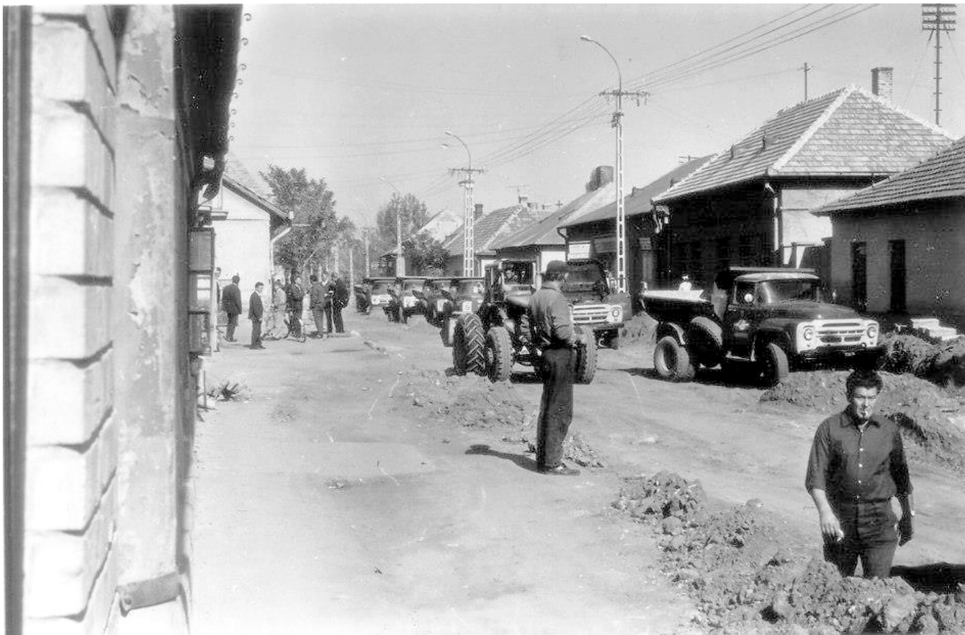
Az állatbolttól észak felé