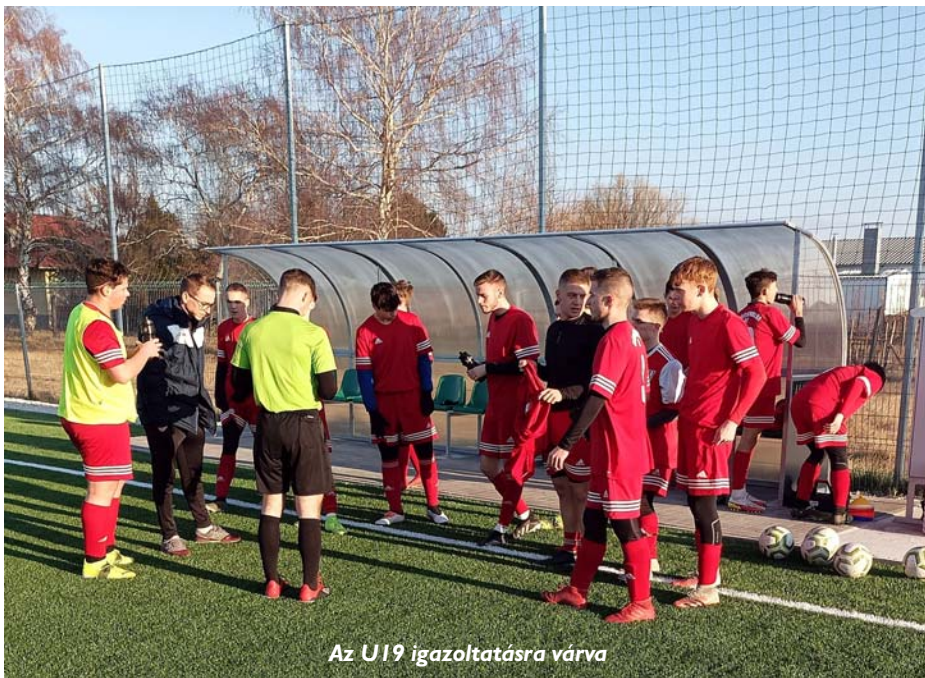
Az U19 igazoltatásra várva