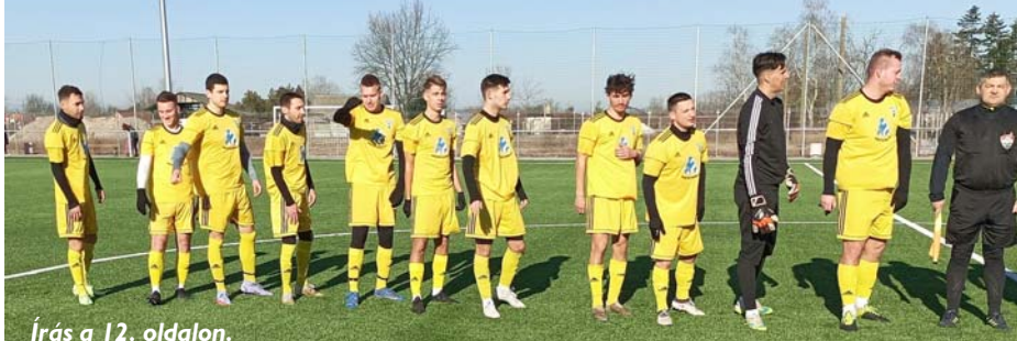
Írás a 12. oldalon.