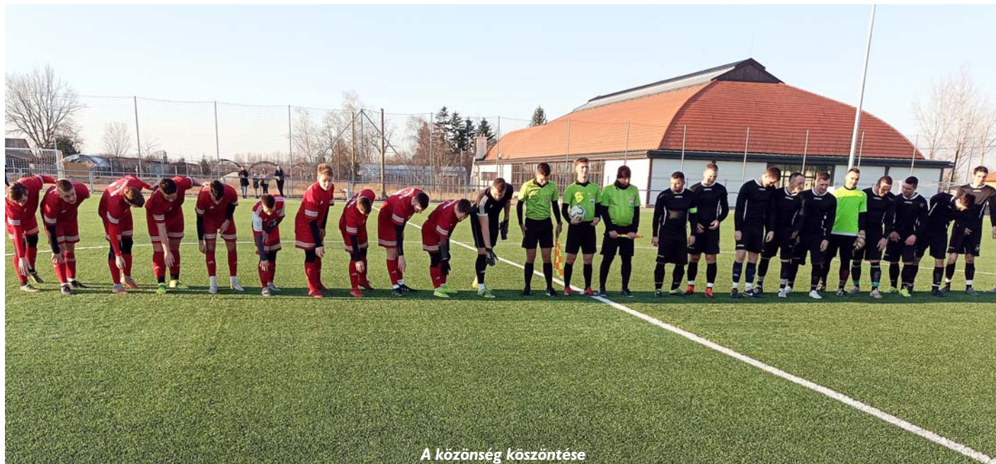
A közönség köszöntése