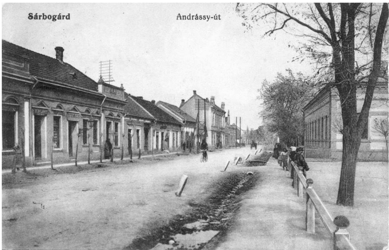
A főút látképe a Főtéri Cukrászdától észak felé nézve