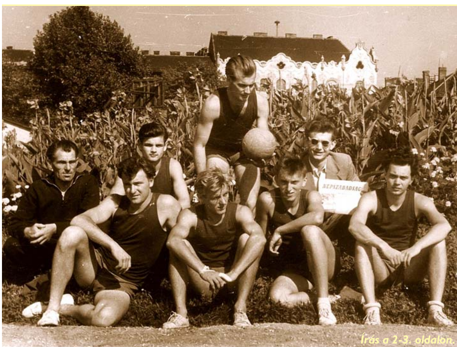
Írás a 2-3. oldalon.