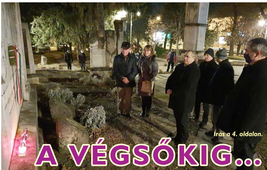
Írás a 4. oldalon.