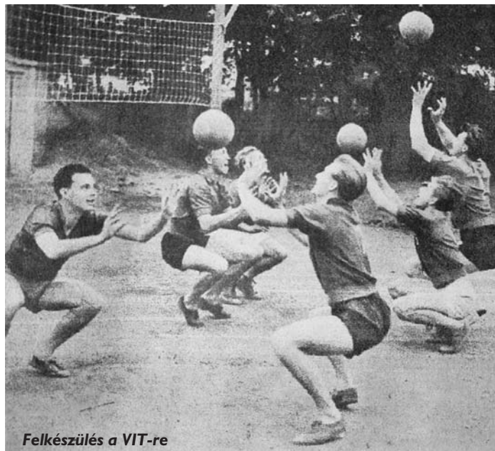
Felkészülés a VIT-re

Szabad idejükben táncos, zenés programokat, városnézést szerveztek nekik.