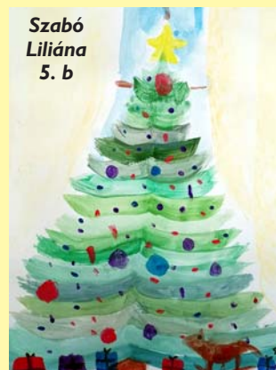
Szabó Liliána 5. b