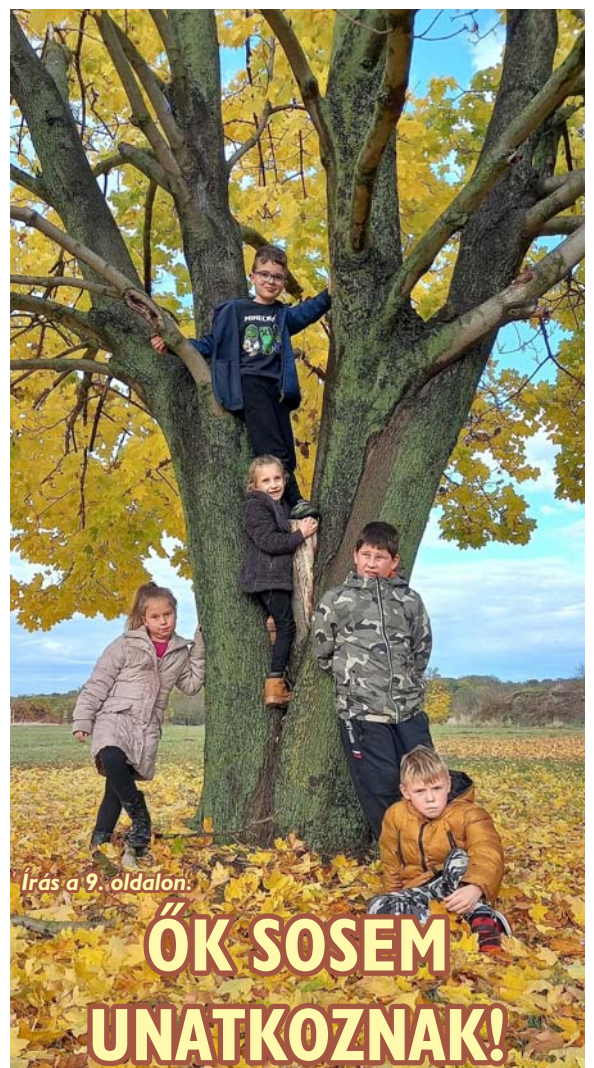
Írás a 9. oldalon.