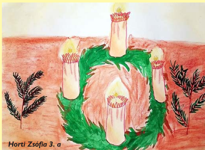
Horti Zsófia 3. a

Az alkotók: Révész Krisztina 5. b, Szabó Liliána 5. b, Fülöp Zoé 4. a, Pukli Luca 4. a, Horti Zsófia 3. a.