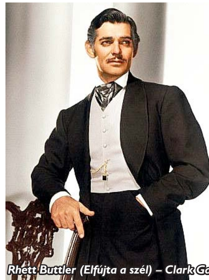
Rhett Buttler (Elfújta a szél) – Clark Gable

Álljunk meg itt! Amerika a mai magyar számára az Egyesült Államokat jelenti, fővárosa Washington. Mexikó vagy Brazília nincs benne, bár Amerikában helyezkednek el. Tehát Rhett Buttler az USA szoborképe.