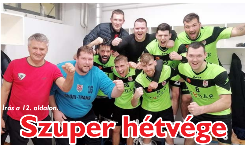
Írás a 12. oldalon.