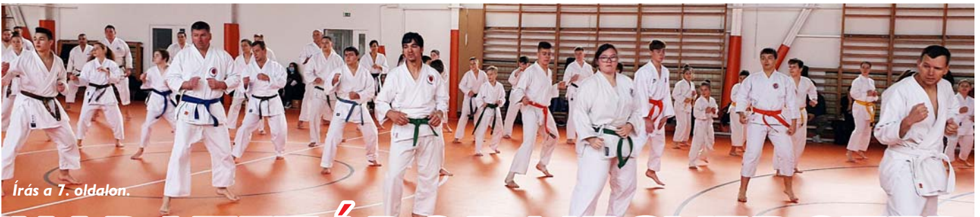
Írás a 7. oldalon.