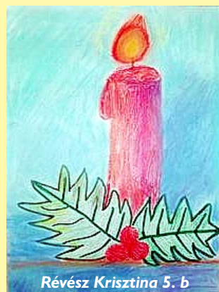
Révész Krisztina 5. b