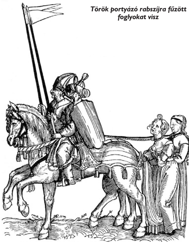
Török portyázó rabszjira fűzött foglyokat visz

A veszprémi kath. püspök, kinek joghatósága alá Bogárd–Tinód tartozott, hol „egyől egyig kálvinista komposzessorok laktak, fel- jelentette a kir. helytartó tanácsnál, hogy felsőbb engedelem nél- kül ott templomot építtettek. A helytartó tanács elrendelte annak