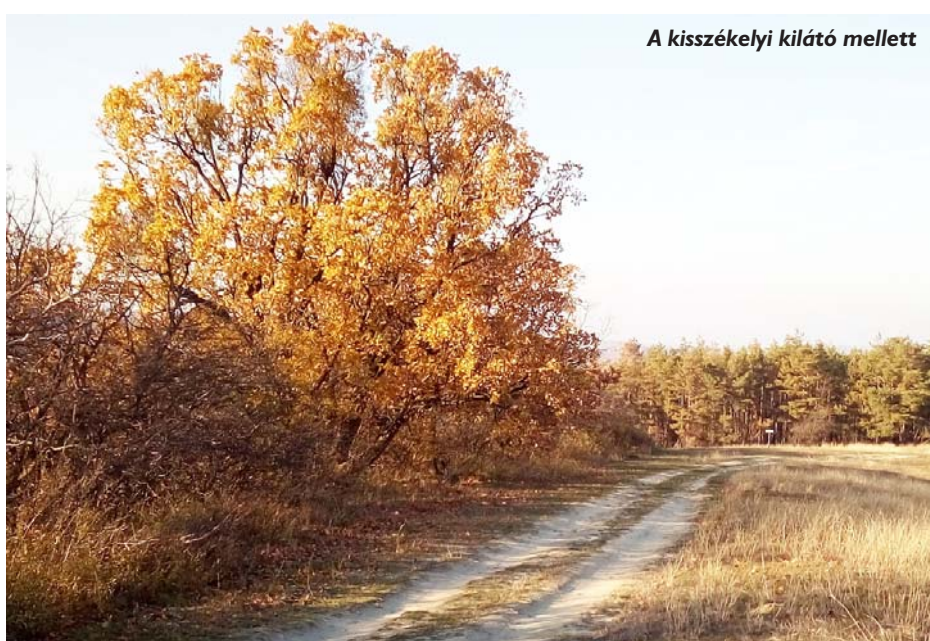
A kisszékelyi kilátó mellett

Az emberiség már sok traumát élt át. A transzgenerációs minták öröklődésének