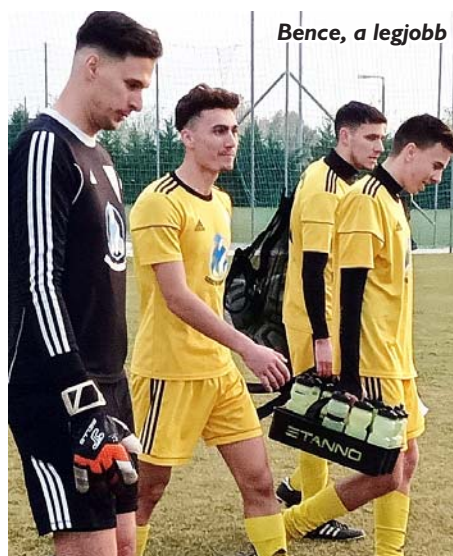
Bence, a legjobb

A tabella végét elfoglaló vendégek ellen kötelező győzelem és lehetőség szerint nagy gólarányú győzelem volt az elvárás. A hazaiak éltek a lehetőségeikkel és az első félidőben ötgólos előnyhöz jutottak. A 10.