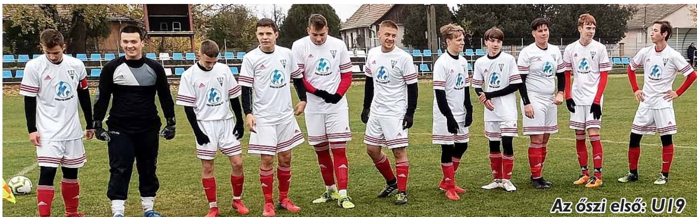
Az őszi első: U19

A tabella végét elfoglaló vendégek ellen kötelező győzelem és lehetőség szerint nagy gólarányú győzelem volt az elvárás. A hazaiak éltek a lehetőségeikkel és az első félidőben ötgólos előnyhöz jutottak. A 10.