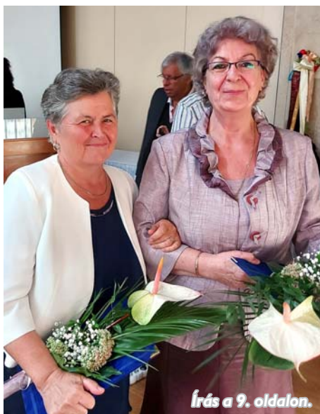
Írás a 9. oldalon.