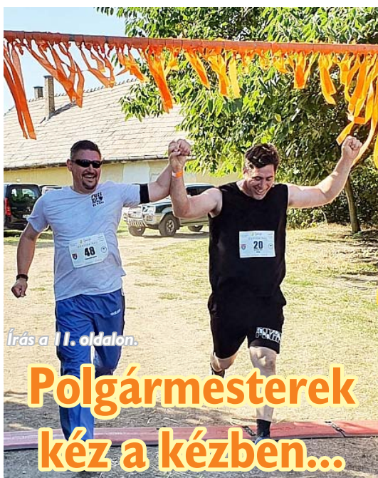
Írás a 11. oldalon.