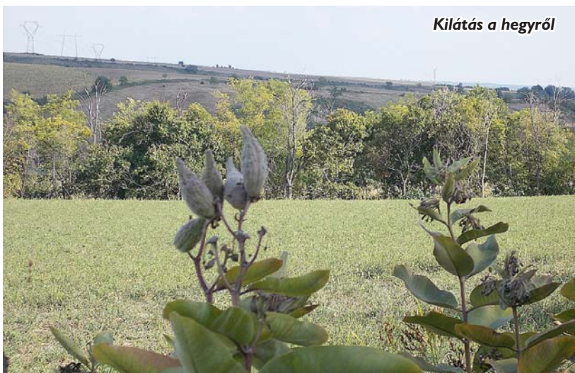
Kilátás a hegyről