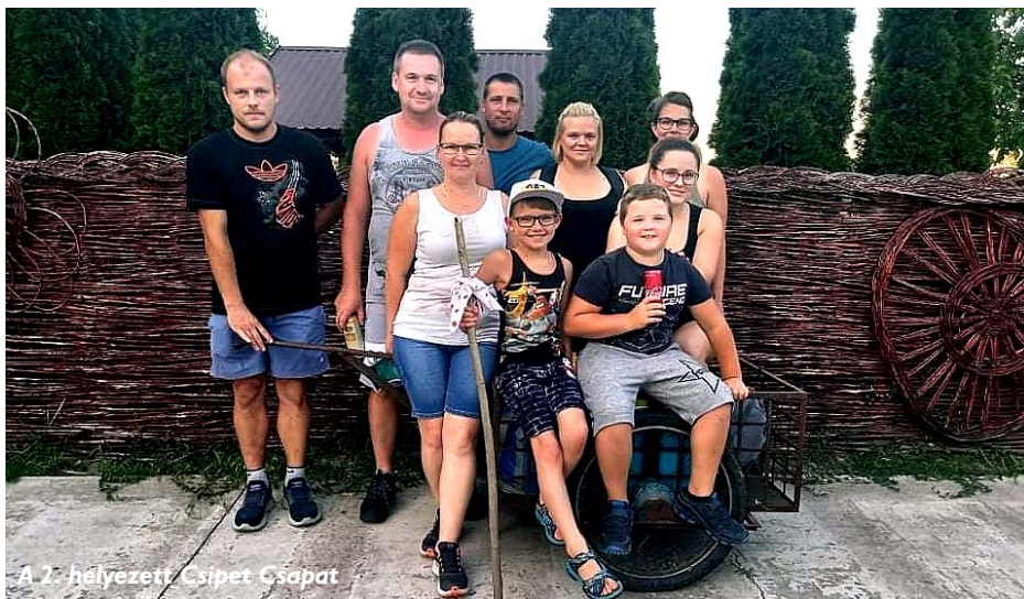
A 2. helyezett Csipet Csapat

emlékplakettet. Az első két hely szoros küzdelmét a csatakiáltásért bezsebelt taps erőssége döntötte el. Különdíjban részesült a legjobb öltözetért az Aznaposok csapata, a legjobb csatakiáltásért a Zumbabák, a legsportszerűbb játékért az Alapi Válysz, valamint a legszerényebb Kinder kommandó és a legpechesebb Sok sikertelen csapat.