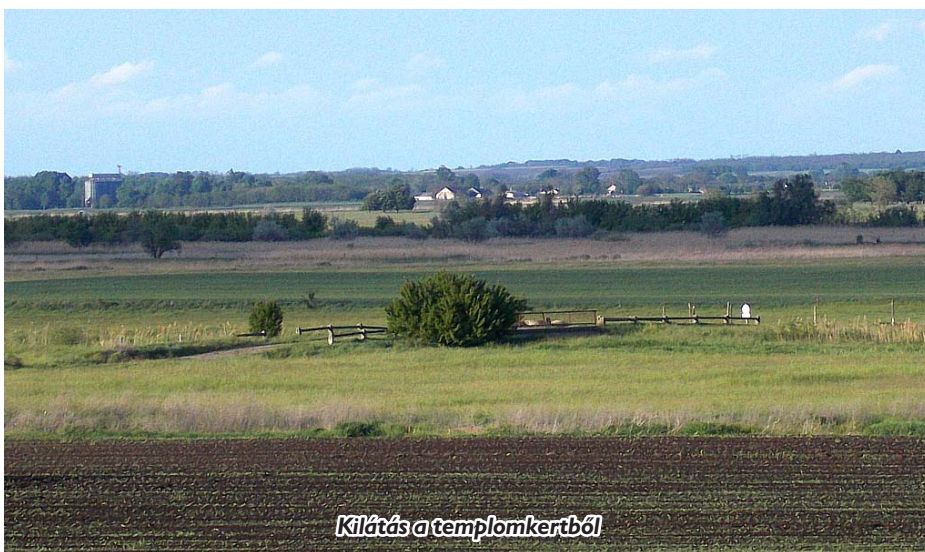
Kilátás a templomkertből