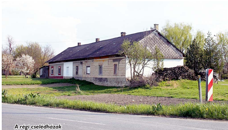
A régi cselédházak

Zichy család birtoka. Édesanyám mesélte, hogy ő ott gyerekeskedett és nagyon szeretett ezen a helyen. Rengeteg gyümölcsfa volt a területen és a munka mellett nagy szabadságban volt része a gyerekeknek. Élete végén visszakíváncozott oda, kíváncsi volt, mi van most „59 pusztán”, de ezt a kérését már nem sikerült teljesítenem.