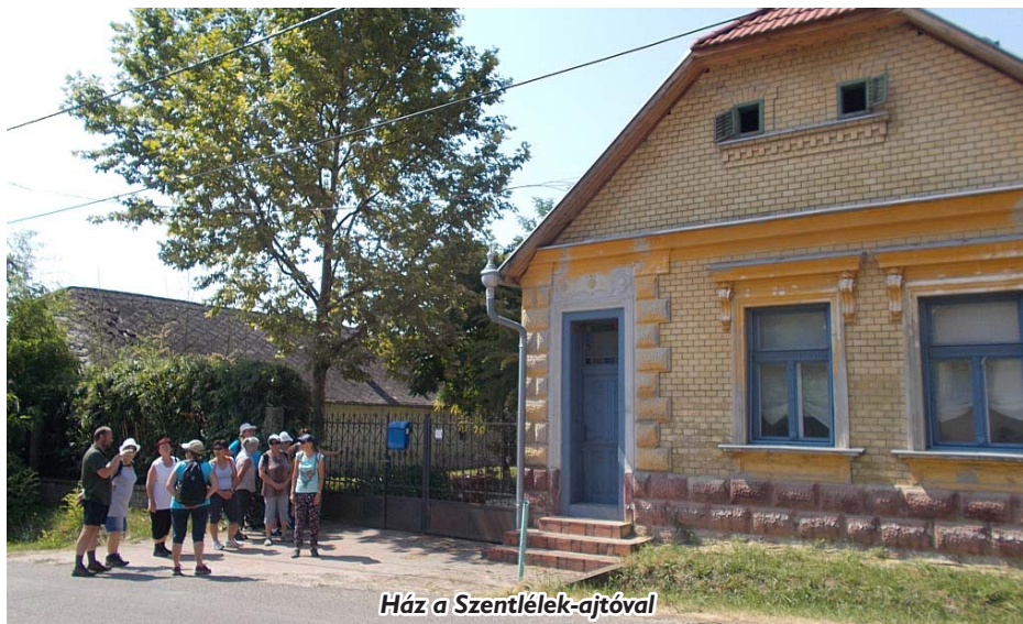
Ház a Szentlélek-ajtóval