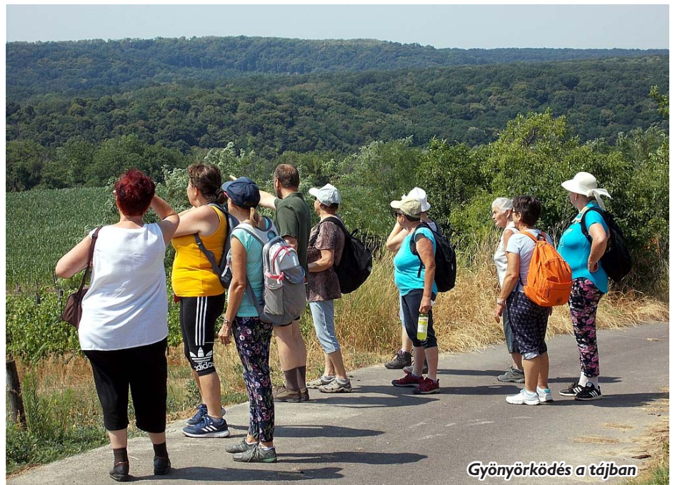
Gyönyörködés a tájban