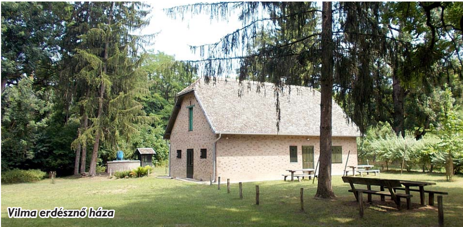
Vilma erdésznő háza