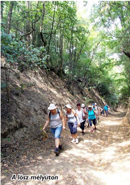
A lősz mélyúton

Számomra megunhatatlan a horizontnak ez a tágassága! Kísszékelyről körbetekintve szinte kitér a világ!