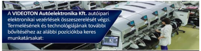
A VIDEOTON Autóelektronika Kft. autóiipari elektronikai vezérlések összeszerelését végzi. Termelésének és technológiájának további bővítéséhez az alábbi pozíciókba keres munkatársakat: