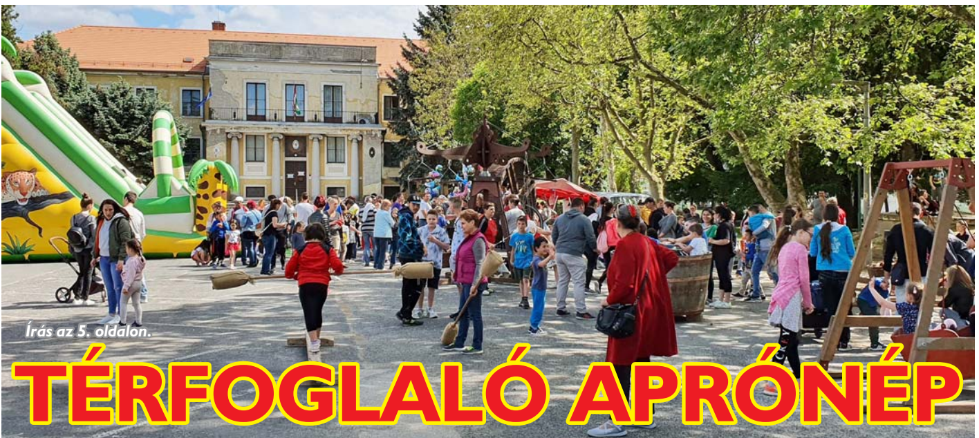
Írás az 5. oldalon.