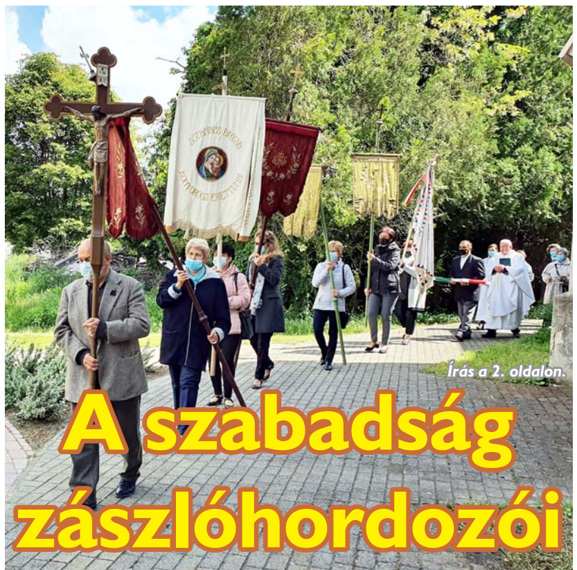
Írás a 2. oldalon.