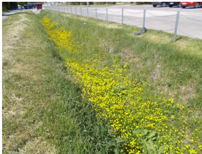
Salátaboglárka – Mikez közti óvoda

A növények is érző lények, csak kevesen tudják ezt. Magától értetődő számunkra, hogy itt vannak a környezetünkben. Talán, ha a Szaharában élnénk, jobban megbecsülnénk a növényeinket, melyek hű társaink – és egy jó barátal nem bánik galádul az ember. Ráadásul a földön nem létezne élet növények nélkül, becsüljük meg hát őket! Akár szobanövény, kerti virág, vagy réti vadvirág, természetettől zöldség, fűszernövény, erdőben élő vagy gyümölcsöt