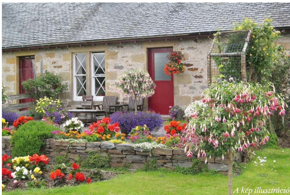
A kép illusztráció

Biztos mindenkinek van a környezetében olyan ember, akinek csodálatos virágai vannak. Van egy idős barátnőm, akinek az udvarába lépve úgy érzem, mesebeli kertbe léptem. Mindenhol virágok nőnek. A