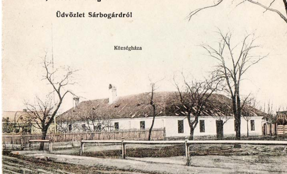
A Plihál-kúria, később a községháza

intézhették volna. Az anyagi lehetőség megteremtésére az előljáróságnak a helytartótanács azzal próbált segíteni, hogy jogosultságot adott a mezőváros számára a heti piacok és országos vásárok tartására, az ebből befolyó bevételek beszedésére. De ekkor még bekerített piacter se volt a városban, ahol a helypénzeket beszedhesék.