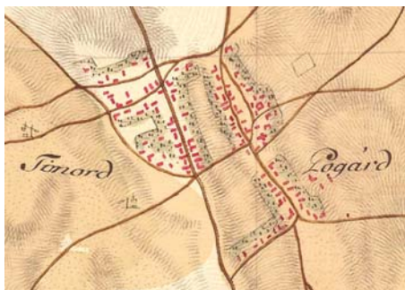
Első katonai felmérés Sárbogárd településszerkezete 1763

Az osztrák mintájú polgári közigazgatást Sárbogárdon hivatalosan 150 évvel ezelőtt, 1871-ben, vezették be. Egészen addig a Bogárd–Tinód közbirtokosság igazgatási ügyeit az Úri utca kúriáiban intézték, peres ügyekben pedig az úriszék ítélkezett. A budai helytartótanács ennél jóval korábban, 1855-ben adott ki hivatalos határozatot Bogárd–Tinód mezővárossá fejlesztéséről, és ekkor hagyták jóvá az egyesített Bogárd–Tinód új hivatalos nevét és címerét is, s lett a település neve – ekkor még csak papíron – Sárbogárd mezőváros.