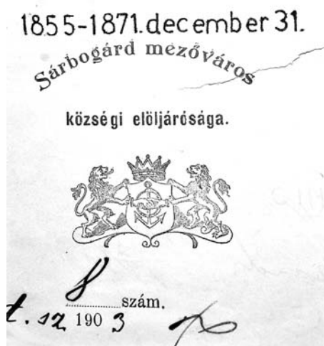
A címér másolata 1903-ból

Sok minden hiányzott még ahhoz, hogy a település a valóságban is mezővárossá váljon. Anyagi és sok egyéb lehetőség hiánya miatt az új, osztrák rendszerű közigazgatásnak a legtöbb feltétele csak az ezredforduló utáni évekre teremtdőtt meg. A közigazgatás ezután is megtarthatta a magyar koronatarományban hivatalosnak a magyar nyelvet és a régi nemesi vármegyerendszer is megmaradt. A kiegyezés után eltűnt a Bach-rendszer hivatalnokserege is az országból. Helyüket a tanult magyar nemesek vették át. Az előljáróságokban a helyi birtokosok, virilisták foglaltak helyet.