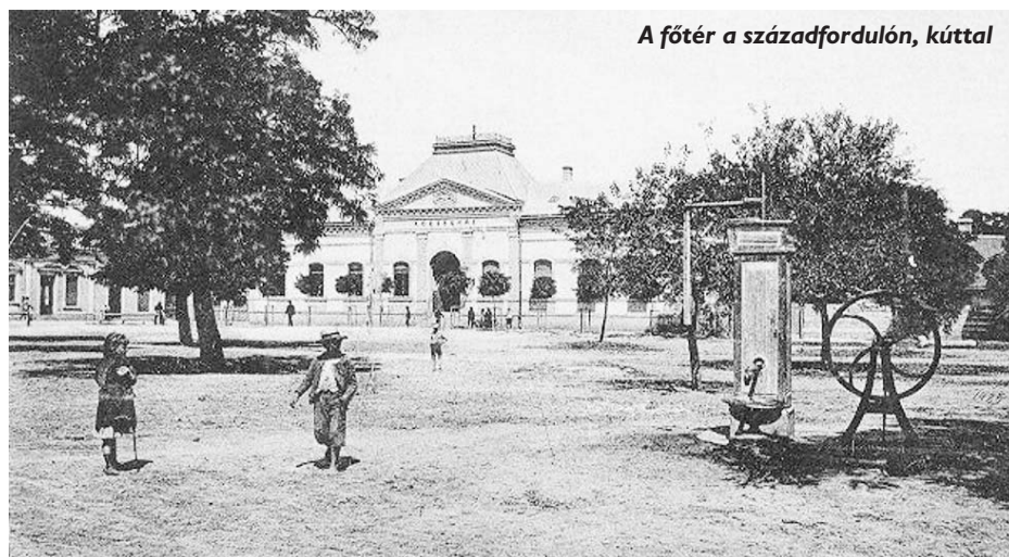
A főtér a századfordulón, kúttal

Az előljáróság hivatalainak működtetése 1872-ig szinte évente változóan bérelt épületekben történt. Aztán jött egy váratlan lehetőség. A város jeles doktora, dr. Plihál Ferenc – úgy véelve, hogy gyógyíthatatlan beteg – 1871. június 15-én az általa vélelmezett (mint kiderült, beképzelt) betegsége elől öngyilkosságba menekült. Halála után nagy területen álló tekintélyes kúriája eladó lett. Ez a kúria ugyan nem Tinódon állt, de az Úri utca körül kiépült Bogárdon sem, hanem éppen a két település között, félúton. Ez megfelelt a tinódi képviselőknek községháza céljára, de a bogárdi képviselők továbbra is kötötték az ebet a karóhoz, hogy ebbe nem mennek bele. Végül a főutcán házzal, üzlethelyiséggel rendelkező, egyre nagyobb gazdasági befolyással bí-