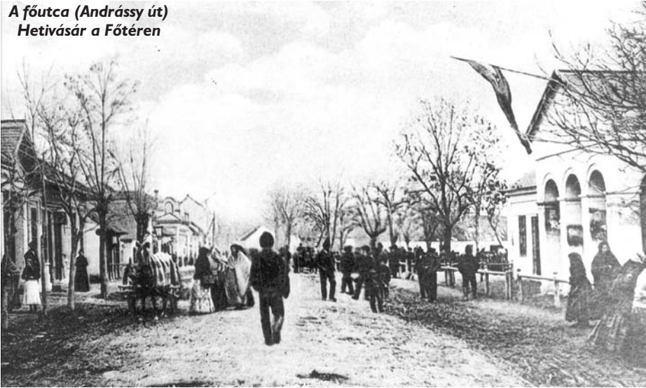
A főutca (Andrássy út) Hetivásár a Fótéren

ró iparosok, kereskedők bírták rá a bogárdi képviselőket, hogy hajoljanak meg a közakarat előtt. Ez megtörtént, s végül 1872-ben megvásárolta az előljáróság a Plihál-kúriát, és átalakították azt hivatali épületté. Elfért benne az előljárósági hivatal mellett még egy jegyzői lakás is.