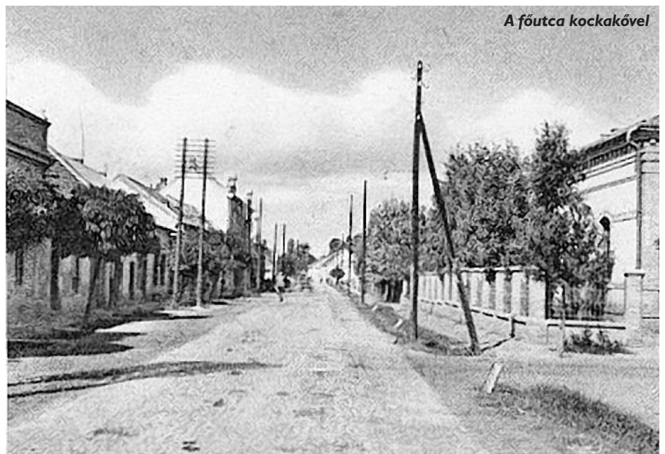
A főutca kockakövel