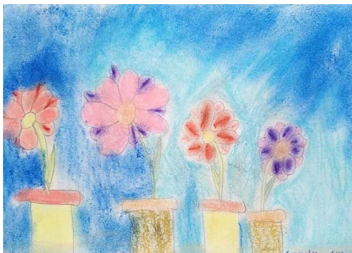
Csecsetka Lilia 3. a – Virágok a szobámban