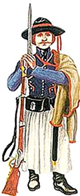
1848-as nemzetőr (a kép illusztráció)

Ezt mondta a mezőföldi ember, amikor se-regenként nagy tömegekben jöttek a túl-a-dunai nemzetőrök.