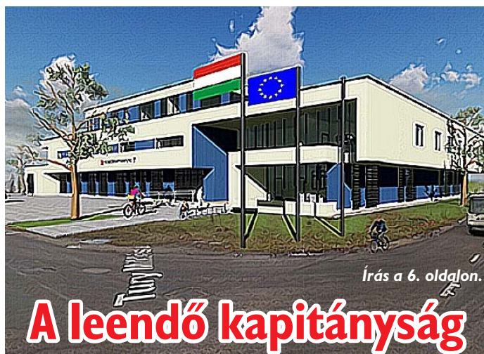
Írás a 6. oldalon.