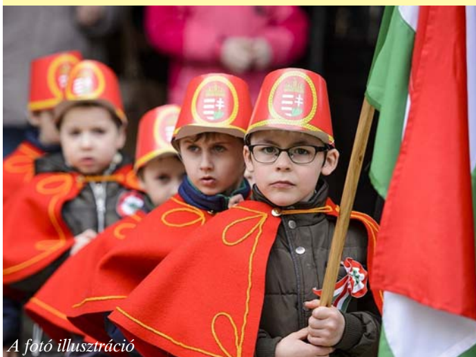
A fotó illusztráció

Kisfiú voltam, amikor egyszer édesanyám énekeskönyvében, a szoltárok között megbújva egy piros-fehér-zöld vékony szalagot találtam. – Mi ez, édesanyám? – kérdeztem. Ő meg így felelt: – Nemzetiszínű pántlika, ilyen a magyar zászló. Nekem pedig nagyot dobbant a gyermekszívem. Mert azt már tudtam, hogy magyarok vagyunk, de magyar zászlót még nem láttam. Ugyanis abban az időben, Trianon után már Jugoszláviához tartozott a szintizsta magyar szülőfalum. Magyar zászlót kitűzni természetesen szigorúan tilos volt.