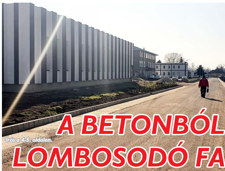
Írás a 4-5. oldalon.