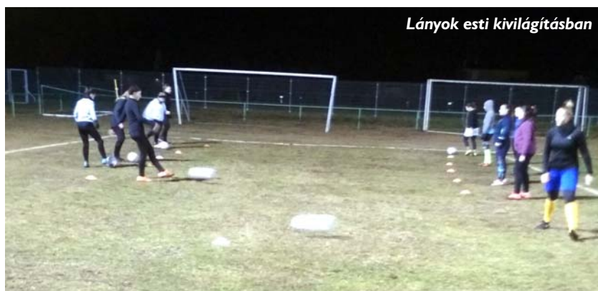
Lányok esti kivilágításban