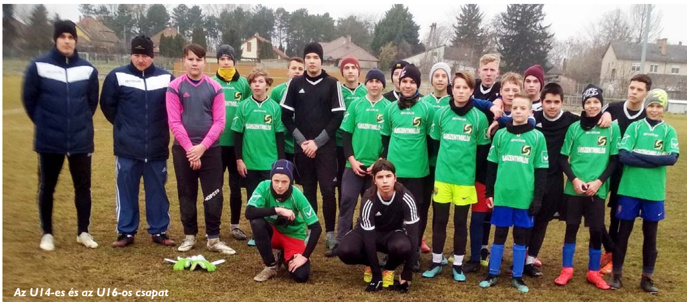
Az U14-es és az U16-os csapat