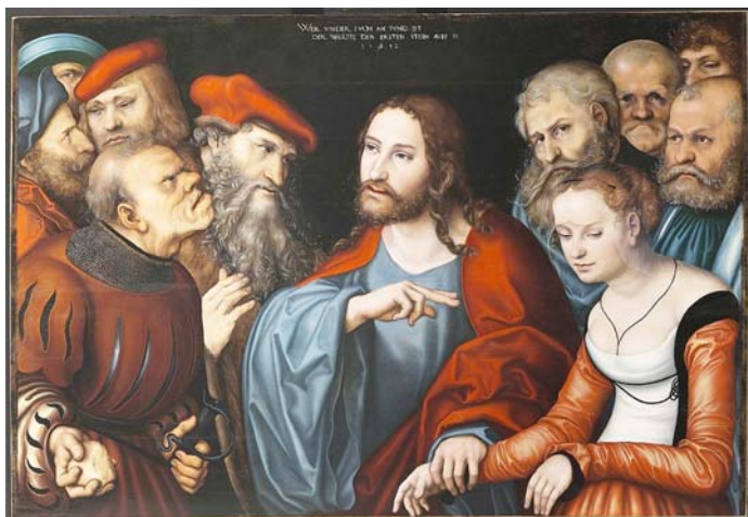
id. Lucas Cranach: Krisztus és a házasságtörő asszony című festménye

Sokak által jól ismert történet a házasságtörő nőnek a története. Nem tudjuk ezt a történetet nem mai emberekként olvasni, és ott a kérdés bennünk: hogyan kerül elénk ez az asszony, miközben a férfi eltűnt az igazságszolgáltató kezek közül. Elengedték, futni hagyták, vagy éppenséggel felismerve azt, hogy ki az a férfi, nem akarták közszemlére tenni. Talán éppen amiatt is, mert az illető közszereplő volt. Hányszor találkoztunk az elmúlt időben olyan közszereplő történetével, ahol sokan voltak kíváncsiak a bukott emberre, vagy a történet részleteire is.