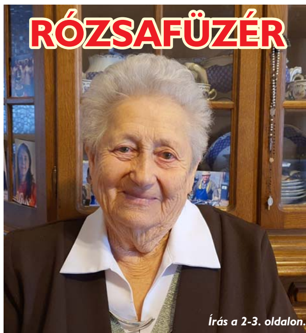
Írás a 2-3. oldalon.