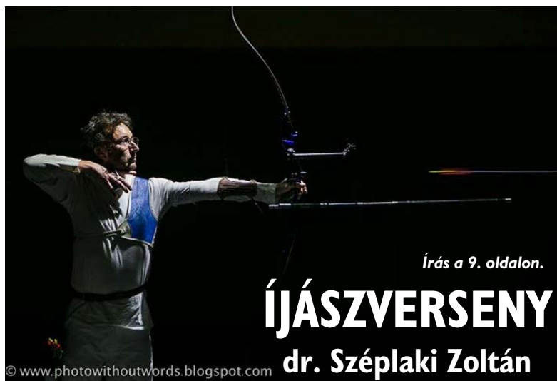
Írás a 9. oldalon.