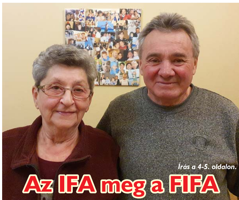
Írás a 4-5. oldalon.