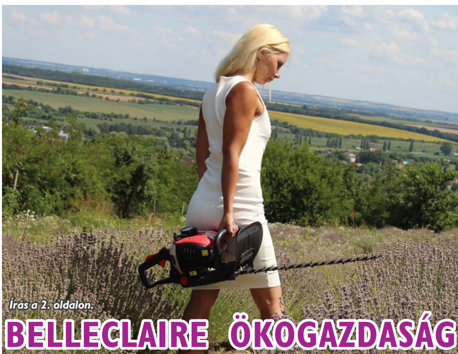
Írás a 2. oldalon.