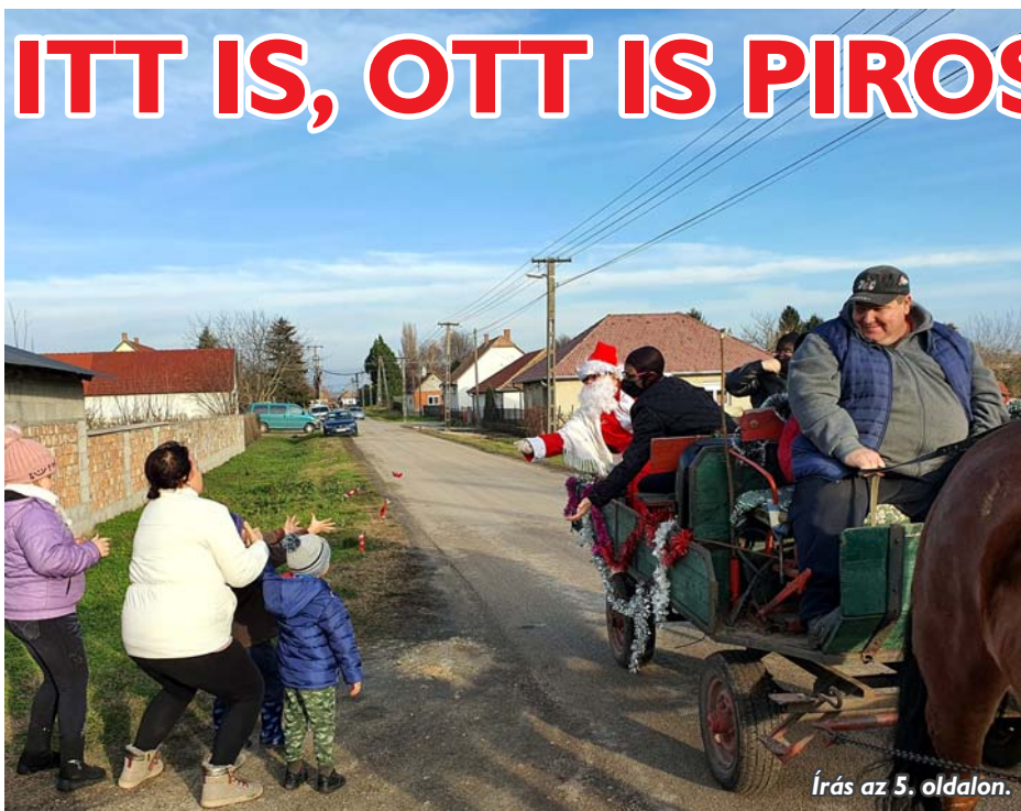
Írás az 5. oldalon.