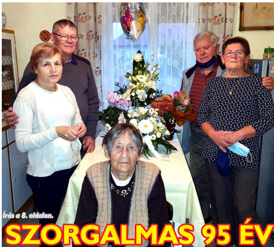
Írás a 8. oldalon.