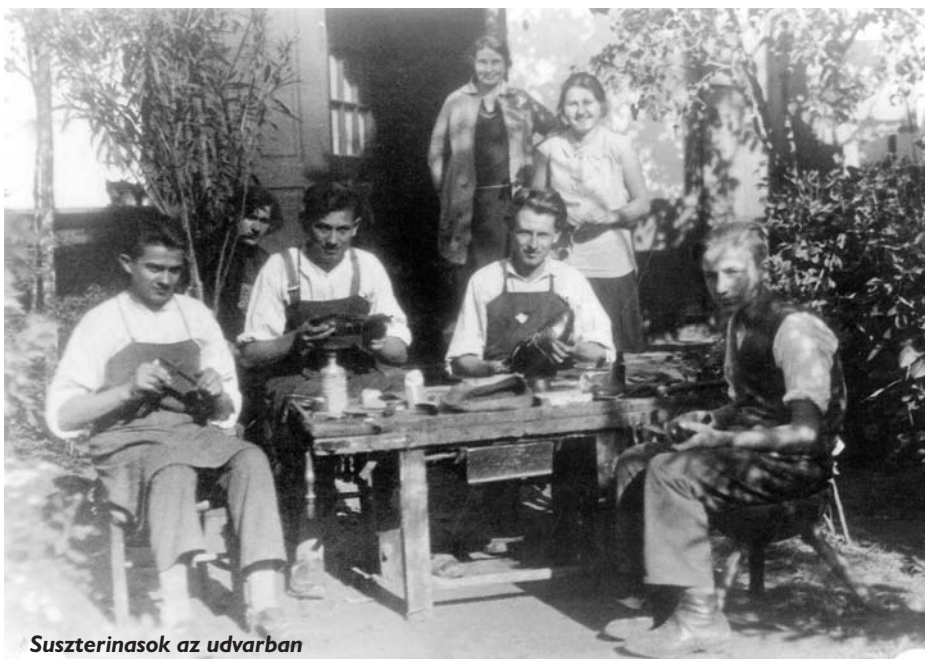
Suszterinasok az udvarban