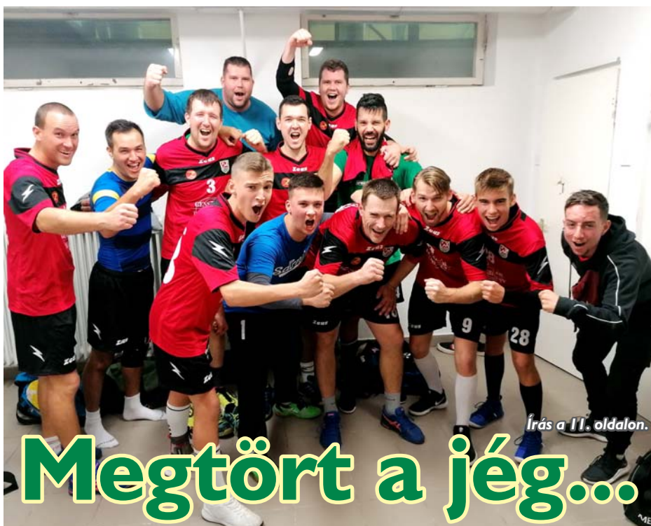
Írás a 11. oldalon.