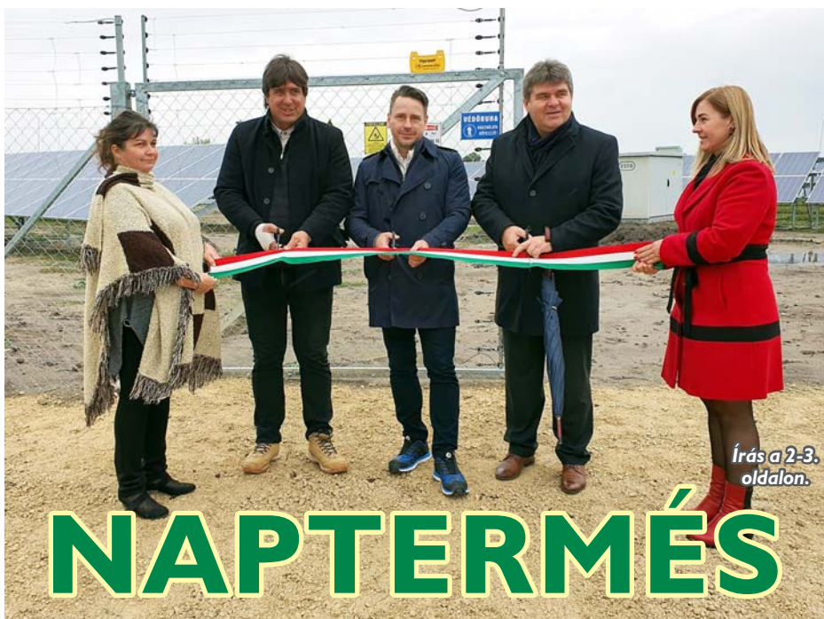
Írás a 2-3. oldalon.