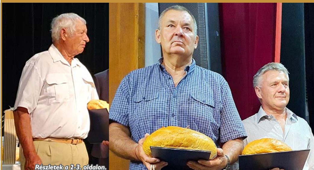
Részletek a 2-3. oldalon.