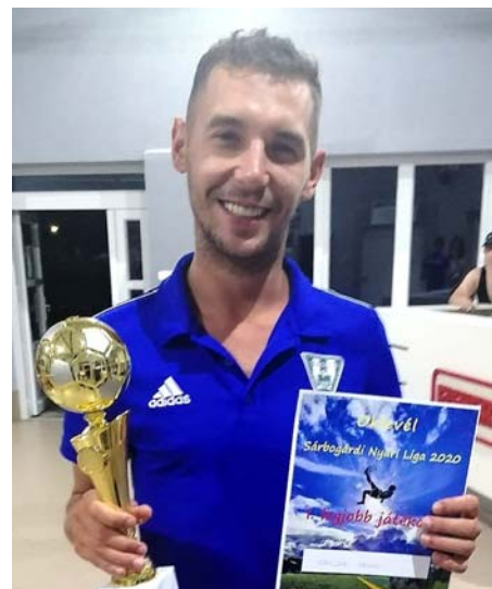
A bajnokság legjobb játékosa

Főszervező: Bór József, tudósító: Rehá Tamás