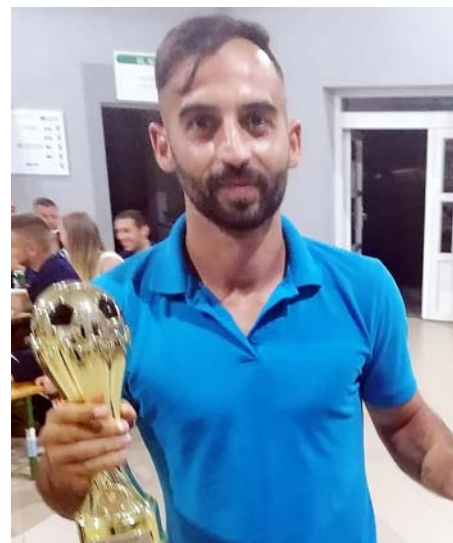
A bajnokság gólkirálya