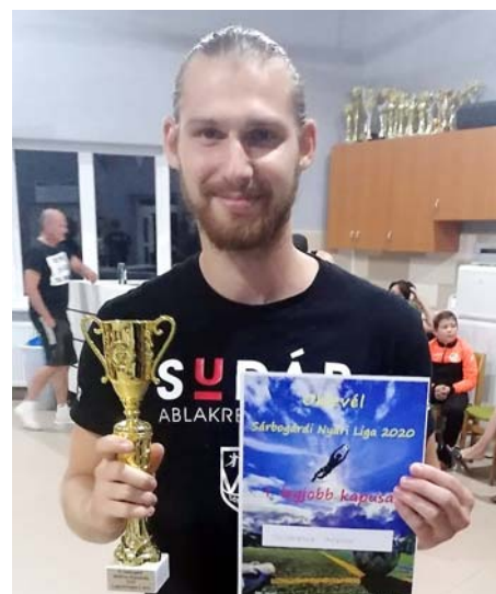
A bajnokság legjobb kapusa