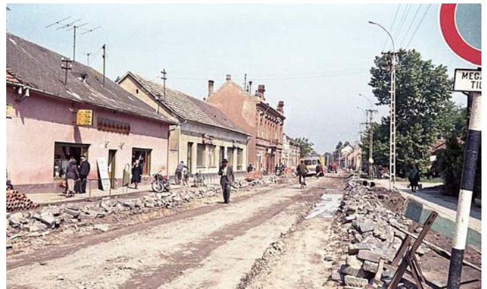
A fenti fotó 1968-ban készült. Az utca aszfaltburkolatot 1969-ben kapott, ekkor épült ki a vízvezeték-rendszer. 1970-ben újult meg az utcai világítás. Ennek „mása” a lenti felvétel 2020. augusztus 12-én, az útfelújítás vége felé.

Piros, fehér, zöld – ezt a természet által szívében megkeresztelt dinnyét termette a magyar föld. Csodálatos jelkép Szent István ünnepe közeledtével. Ha nem is kenyér, de megszentelt betevő falat.