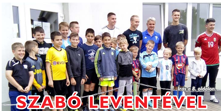
Írás a 8. oldalon.