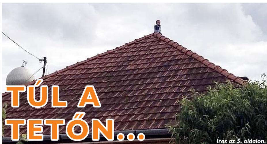
Írás az 5. oldalon.