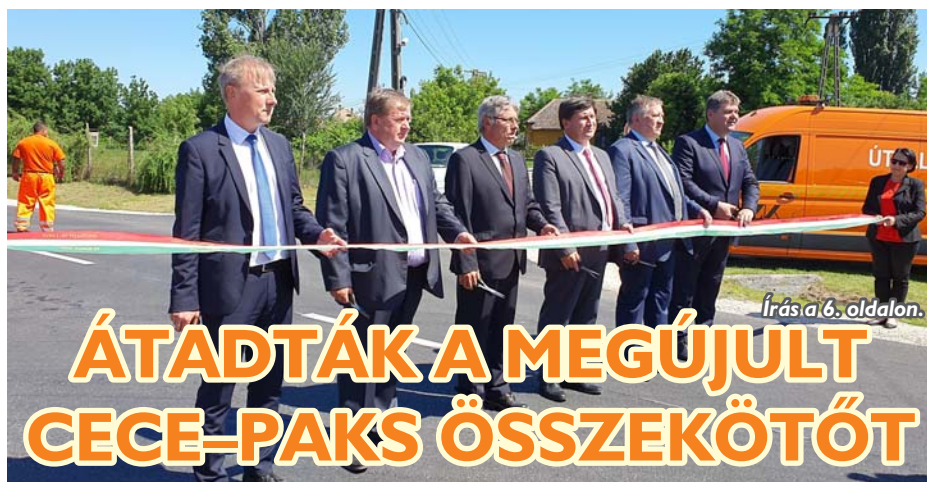
Írás a 6. oldalon.