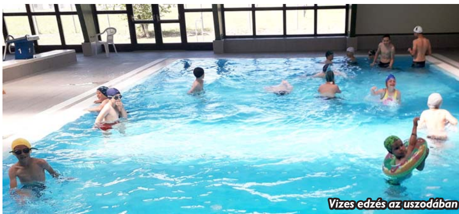
Vizes edzés az uszodában