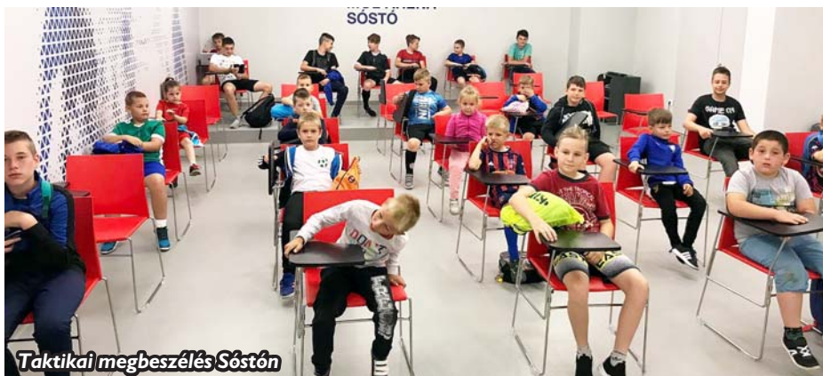
Taktikai megbeszélés Sóstón