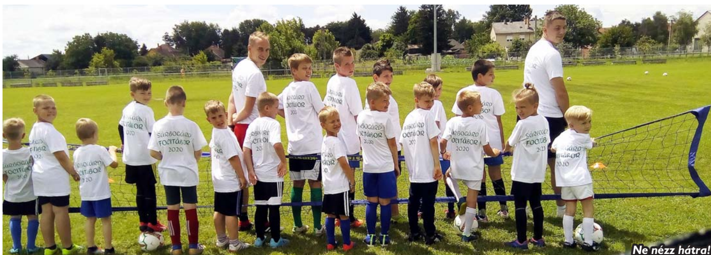
Ne nézz hátra!