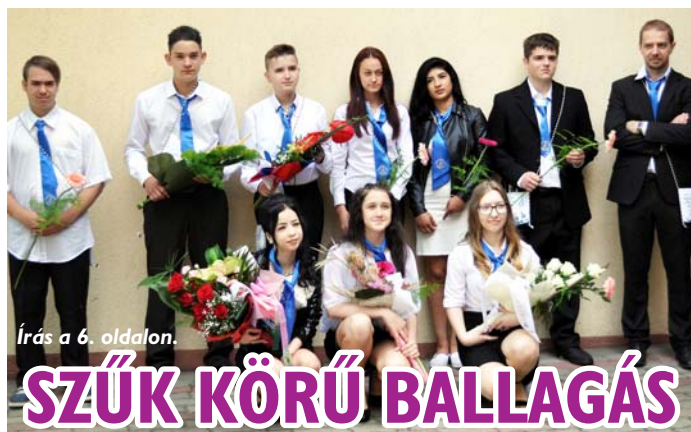
Írás a 6. oldalon.