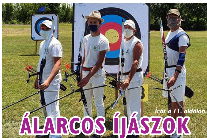
Írás a 11. oldalon.