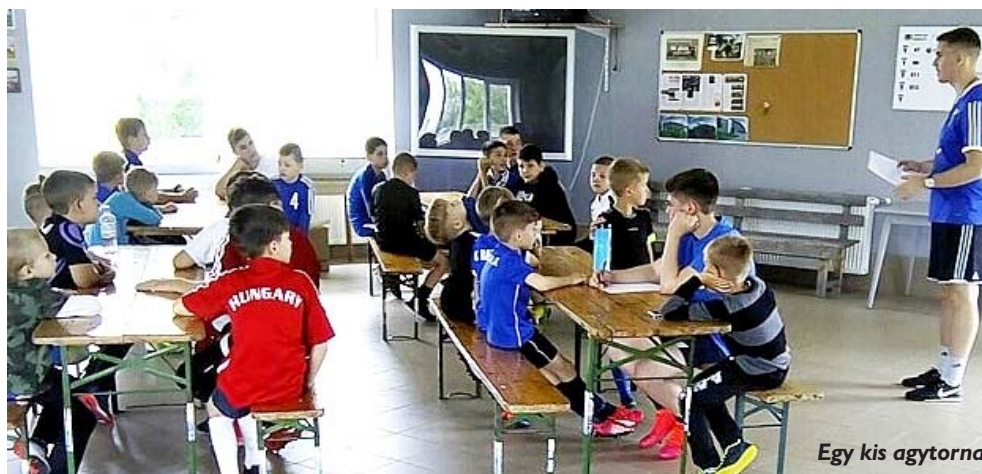
Egy kis agytorna