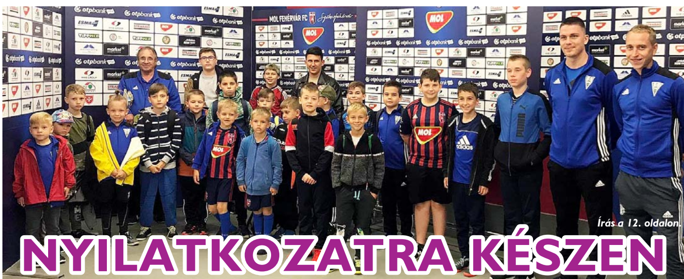
Írás a 12. oldalon.