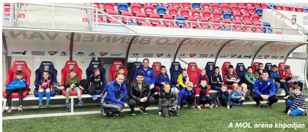
A MOL aréna kispadján