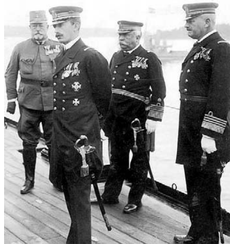
Károly császár látogatása a Viribus Unitison, 1917-ben. A császár mögött a flottaparancsnok, Maximilian Njegovan tengernagy, a kép jobb szélén pedig a csatahajó parancsnoka, Janko Vukovic de Podkapelski.

Íme az előzmények: hajónk az Osztrák–Magyar Monarchia egyik legszebb hajója volt. Tengerészetünk első divíziójaként teljesített szolgálatot. Tizenkétezer fő volt a Viribus unitis személyzetének a létszáma. A hajó Vukovics sorhajókapitány parancsnoksága alatt állott. Később ő lett a szerb flotta parancsnoka. Népszerű ember volt, emberséges, szerettük.