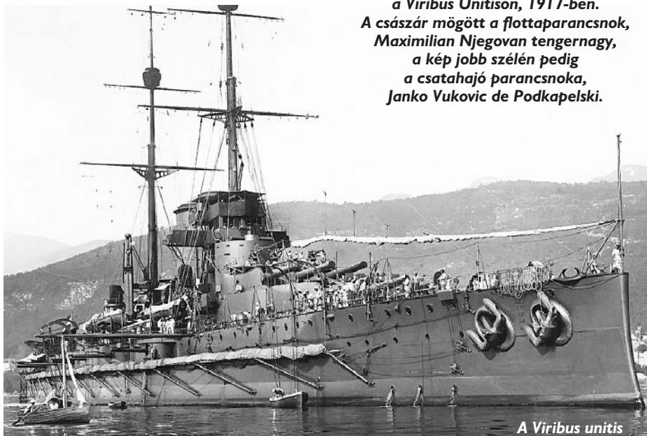
A Viribus unitis