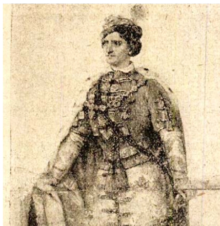
EGRESSY GÁBOR a híres tragikus, Petőfi legjobb barátja

– Azután „Fel, fel e vérző kebelről” dal helyett reákezdjük, hogy: „A virágnak megtiltani nem lehet”.