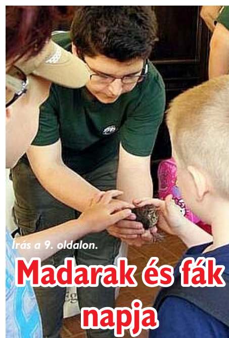
Írás a 9. oldalon.