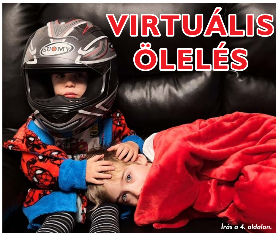
Írás a 4. oldalon.