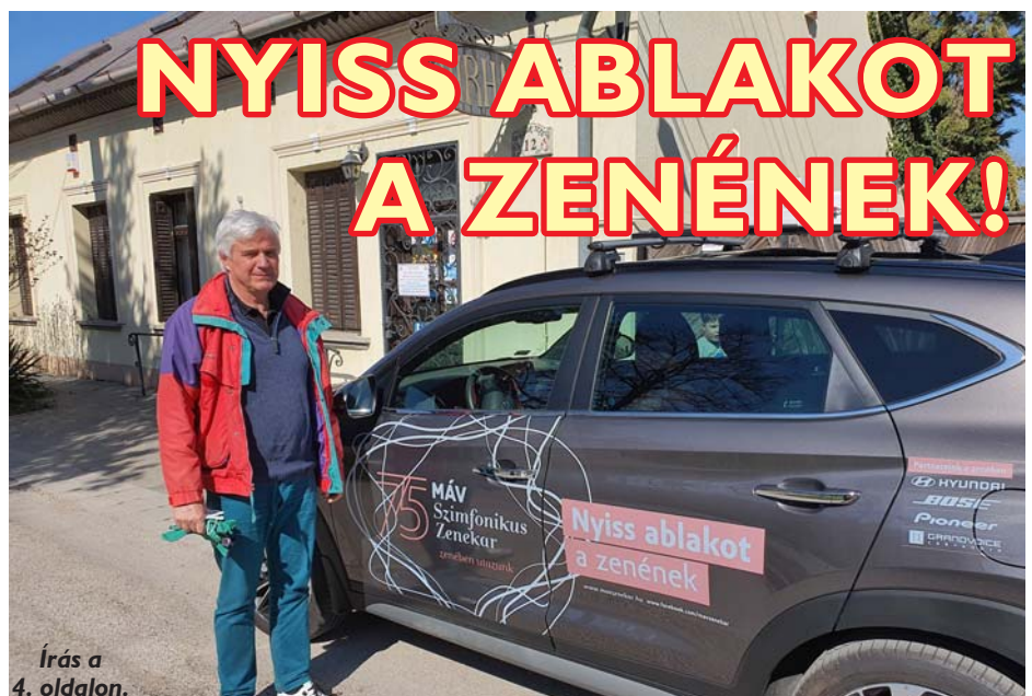
Írás a 4. oldalon.