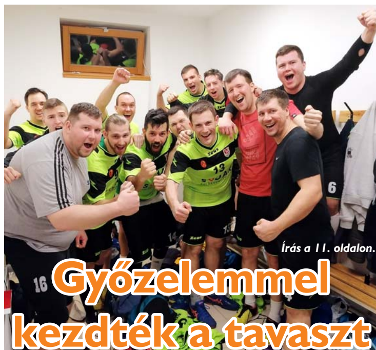
Írás a 11. oldalon.