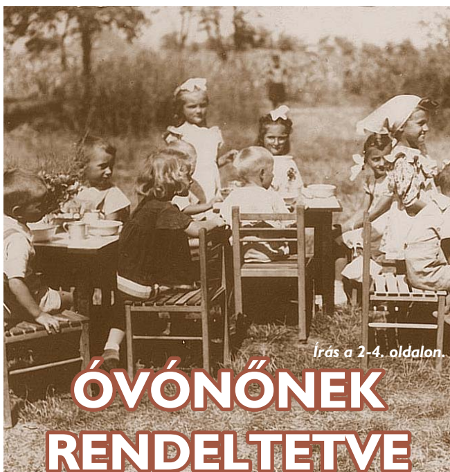
Írás a 2-4. oldalon.