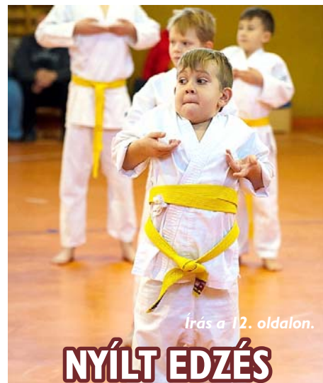
Írás a 12. oldalon.