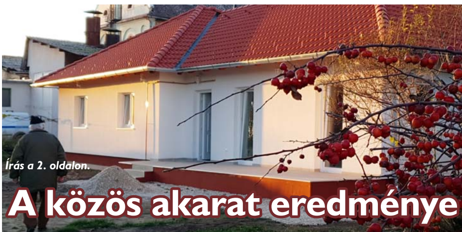
Írás a 2. oldalon.