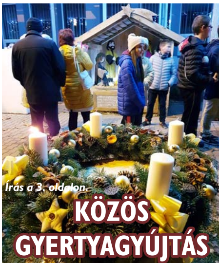
Írás a 3. oldalon.