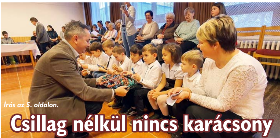
Írás az 5. oldalon.