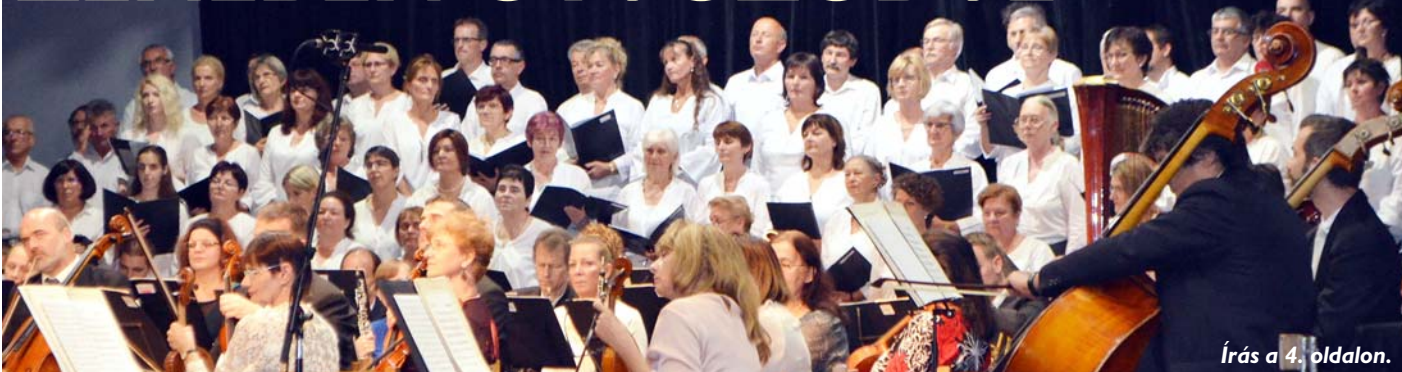
Írás a 4. oldalon.