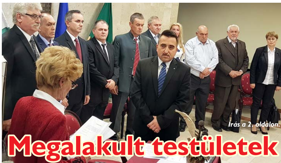
Írás a 2. oldalon.