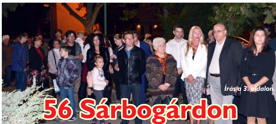
Írás a 3. oldalon.