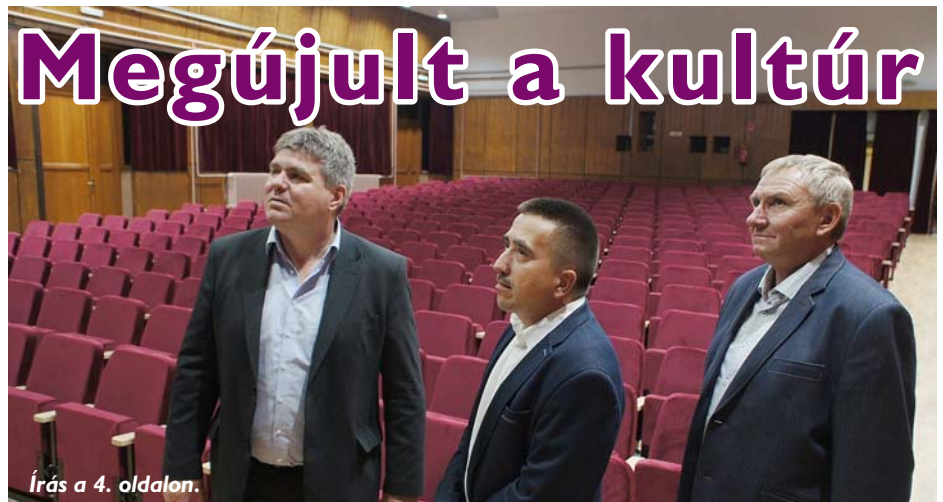
Írás a 4. oldalon.