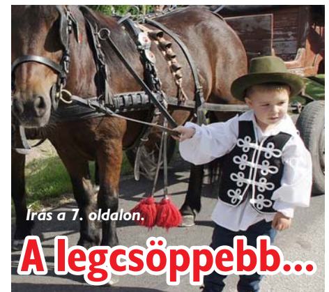
Írás a 7. oldalon.