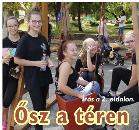
Írás a 2. oldalon.