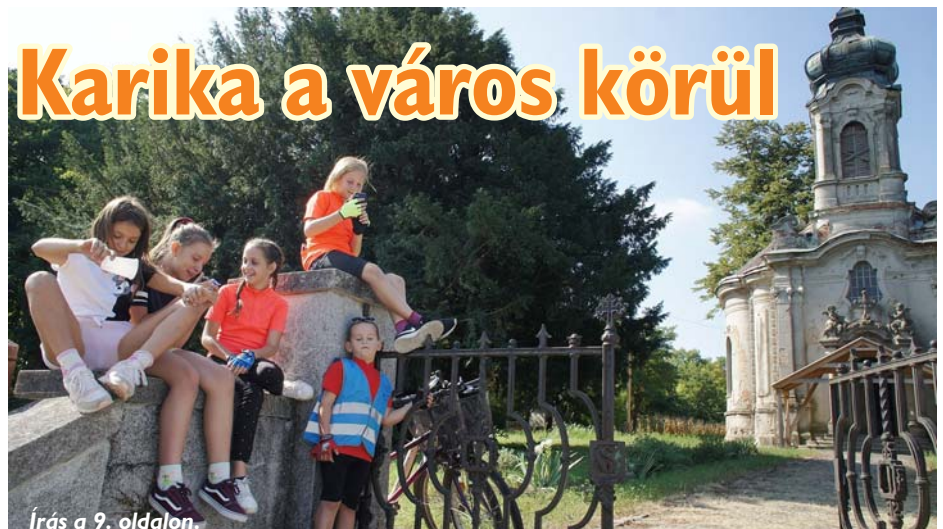
Írás a 9. oldalon.