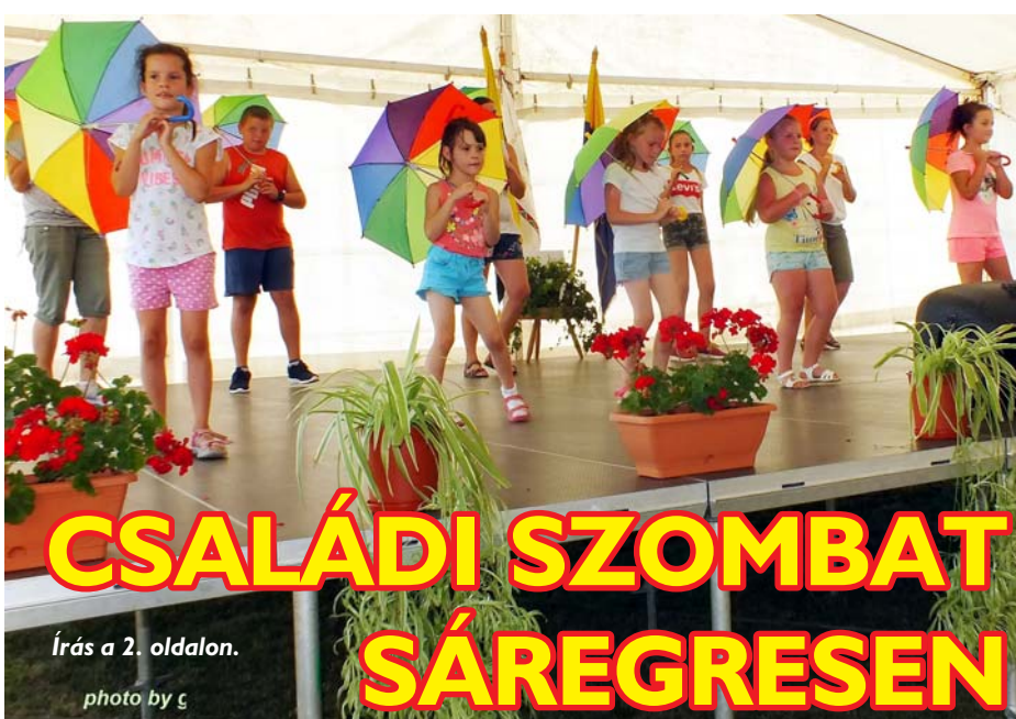
Írás a 2. oldalon.