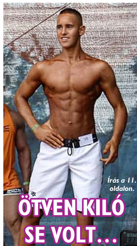
Írás a 11. oldalon.