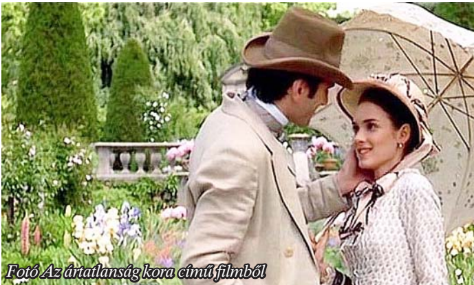
Fotó Az ártatlanság kora című filmből

Mielőtt a nők bemennek a házba, az ifjú úrnak megadatik, hogy levett kalappal néhány mondatot váltson az ifjú hölgygel. Félénken megdicséri a ruháját, a kisasszony elpirul, lesüti a szemét, az édeset. Az anya megköszöni, hogy a fiatalember elkísérte őket a Múcsarnokba a kiállításra, meginvitálja őt szerda délutáni teázásra, amikor több kedves ismerős is ott lesz. Az úr köszönetképpen könnyedén meghajítja a fejét, természetesen megjelenik a teán. Egy kibontakozó szerelmi regény egyik fejezetébe pillantottunk be, már nem is az elsőbe. A meginvitálás téra nem semmi. El fog jönni a pillanat, amikor az ifjú szüntelen esedezésére, a hölgy ismételt, szemérmes visszautasítgatása ellenére valahol, egy sarokban, a kapuban búcsúzás közben a fiatalok ajka egy másodpercre összeér. Ez már komoly dolog, aligha létezik visszaút. Mennek a dolgok a maguk útján. Ő, elkövetkezik a mátkaság, a gyűrűváltás, a pezsgőspoharak muzsikája az összes rokon jelenlétében. El lehet képzelni a nagymamát, aki a könnyeit törölgeti kedvenc unokája életének ilyen sorsfordító eseménye láttán. És már nem kell titokban csókot váltani, a csókok újra és újra ismétlődnek, egyre forróbbá válnak parkban, lakószobában, közvetlenül az ágy szomszédságában.