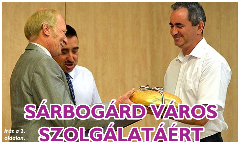
Írás a 2. oldalon.