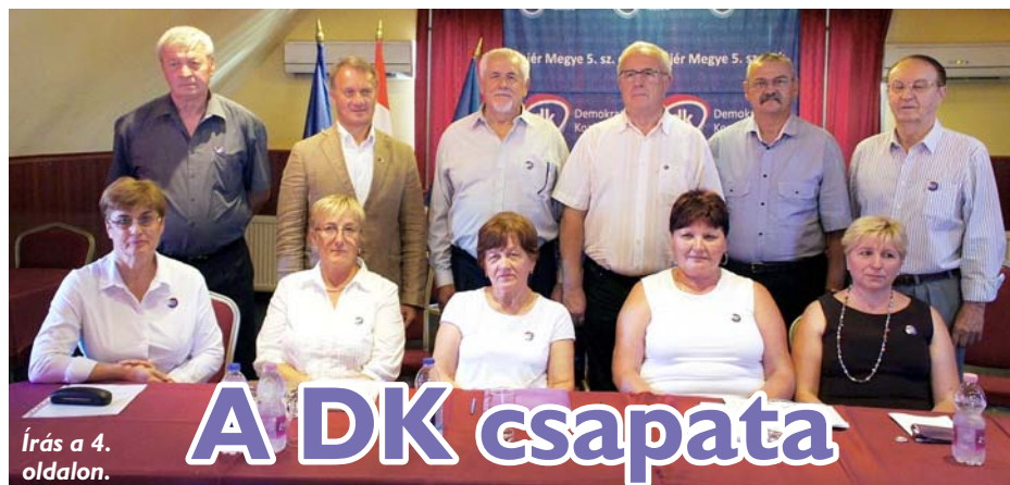
Írás a 4. oldalon.