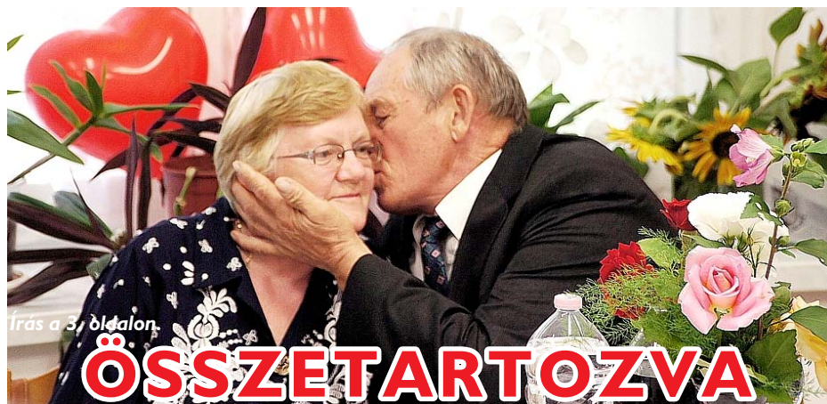
Írás a 3. oldalon.