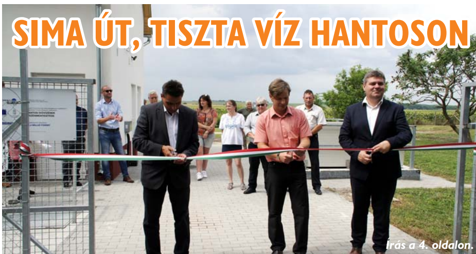
Írás a 4. oldalon.