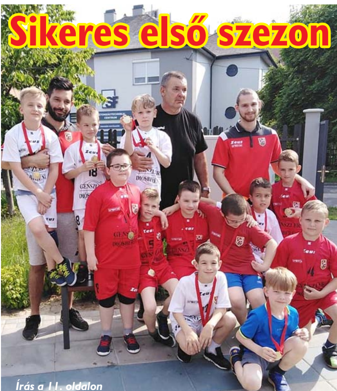
Írás a 11. oldalon