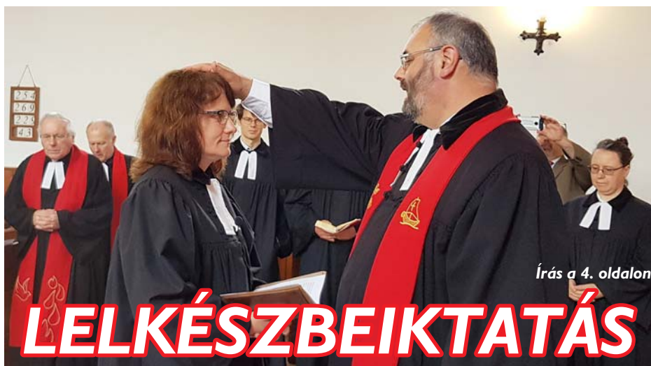
Írás a 4. oldalon