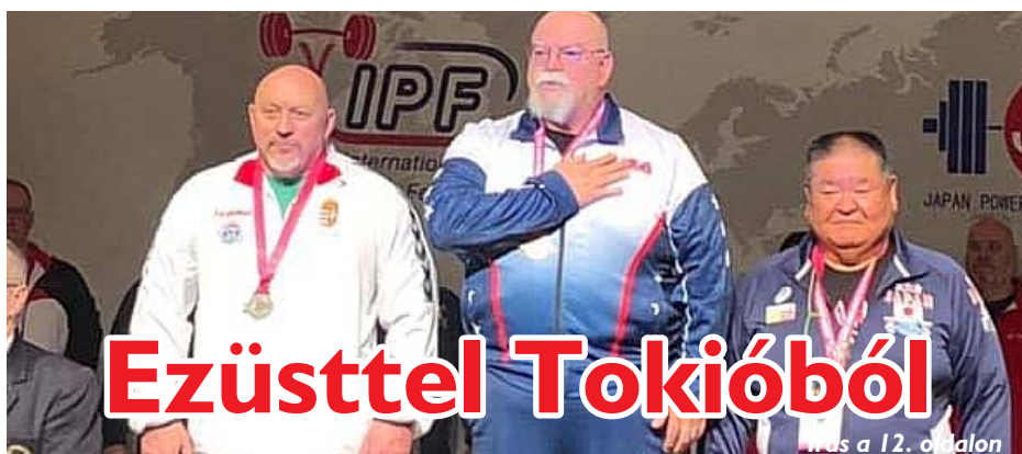
Írás a 12. oldalon