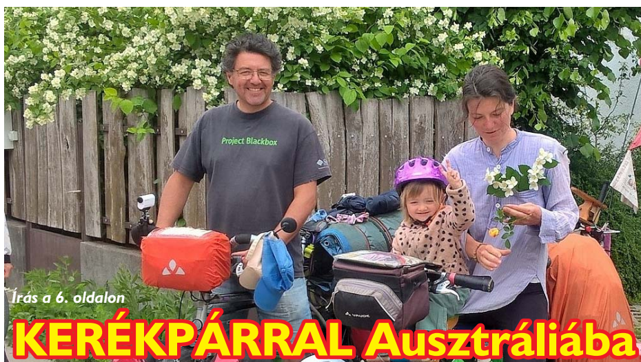
Írás a 6. oldalon