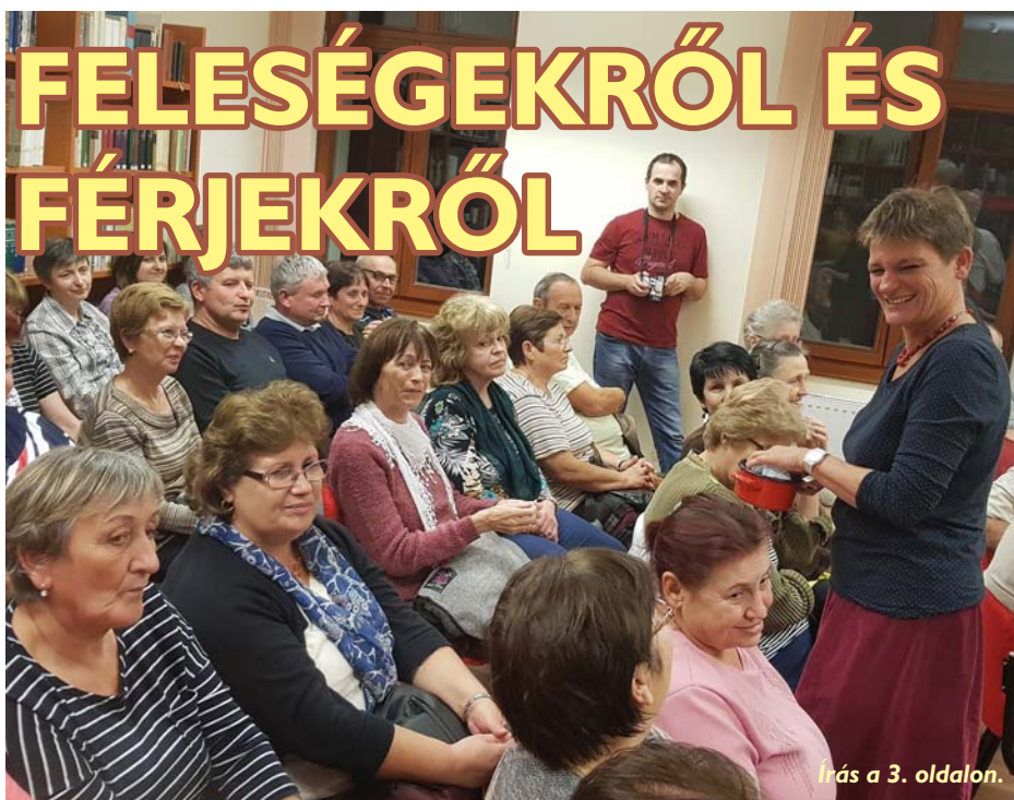
Írás a 3. oldalon.