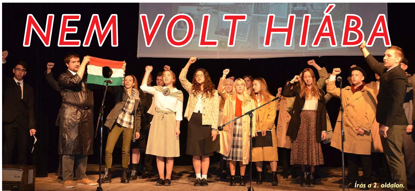
Írás a 2. oldalon.