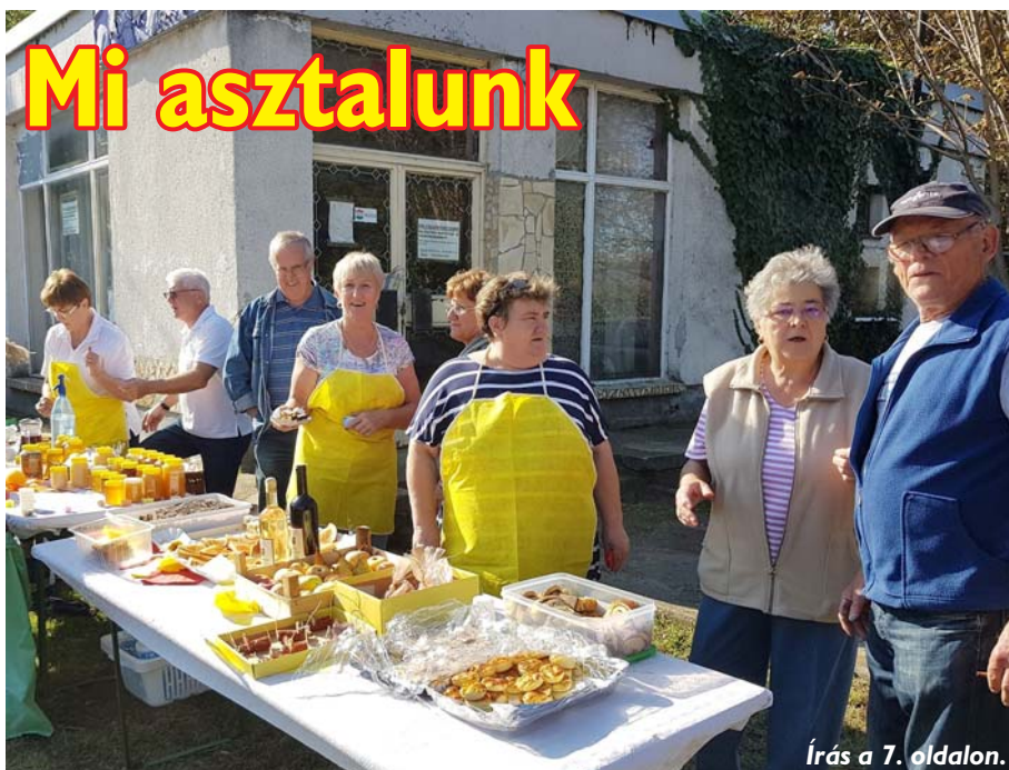
Írás a 7. oldalon.