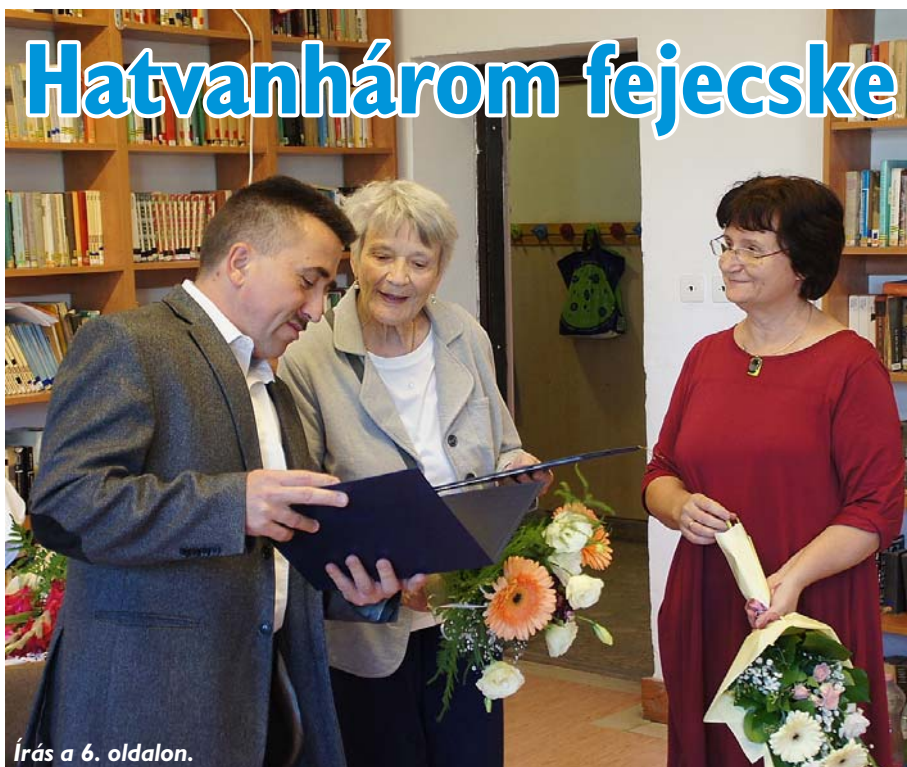
Írás a 6. oldalon.