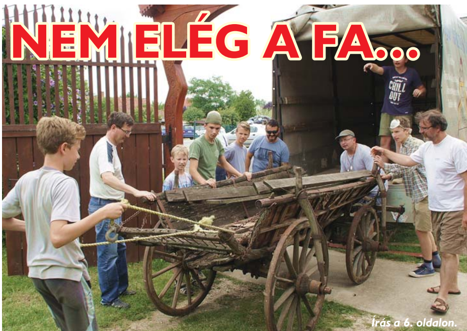
Írás a 6. oldalon.