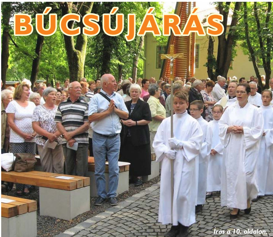
Írás a 10. oldalon.