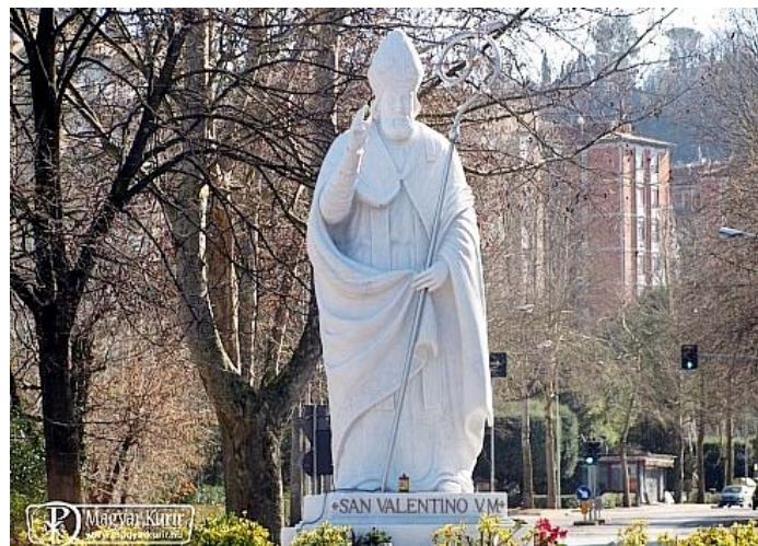
Szent Bálint szobra Terniben

Régi szokás szerint Európa-szerte a farsang a párválasztás ideje (ez a húshagyói vénlánycsúfolásnak, a húshagyóig el nem kelt lányok csúfolásának az alapja). A hagyomány ezt elsősorban Bálint-hoz köti. A francia és a horvát néphit szerint például a madarak is ezen a napon tartják menyegzőjüket