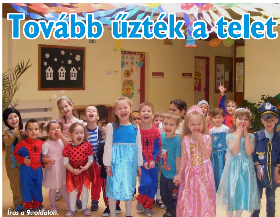
Írás a 9. oldalon.