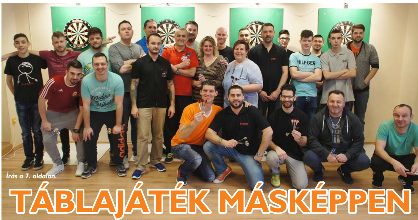
Írás a 7. oldalon.