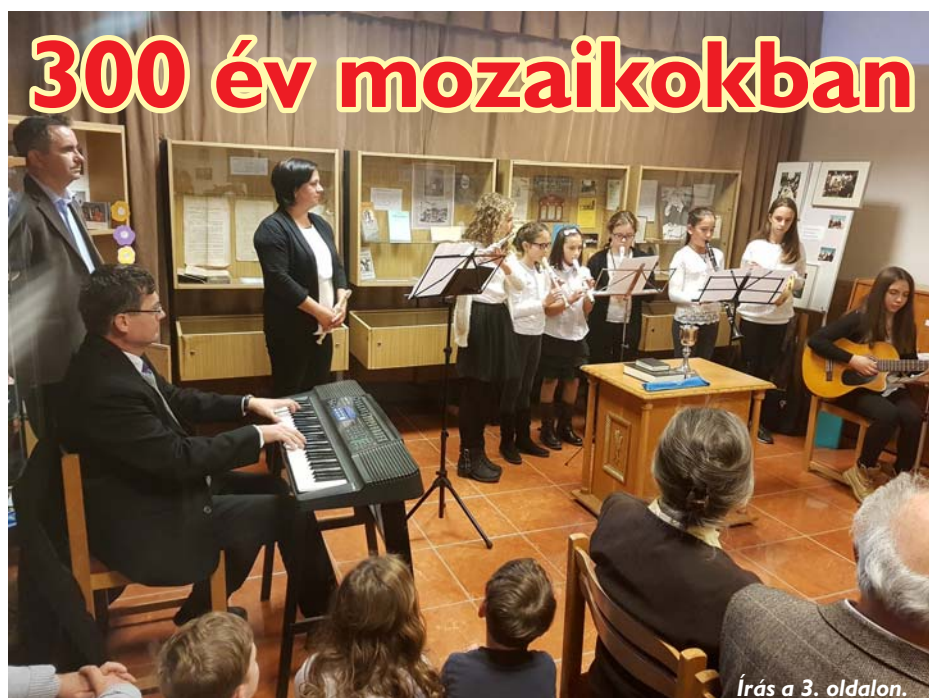
Írás a 3. oldalon.