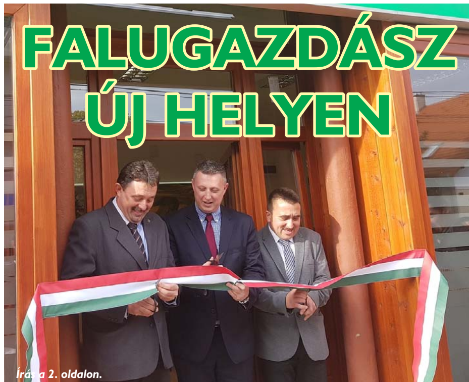
Írás a 2. oldalon.