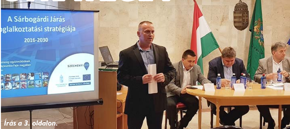
Írás a 3. oldalon.