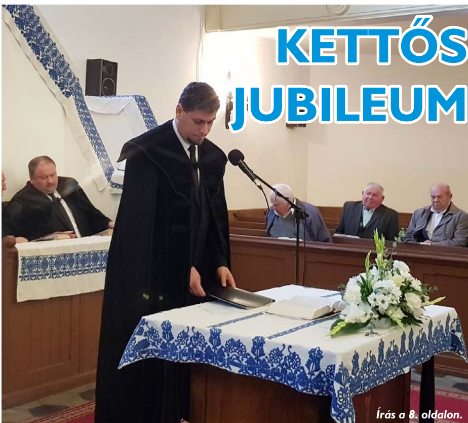
Írás a 8. oldalon.