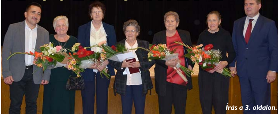
Írás a 3. oldalon.