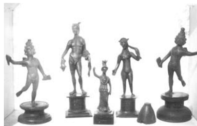
Római háziszentély leletanyaga Sárszentmiklósról

Sárszentmiklós határából több római kori lelet került elő. Ezeket a Magyar Nemzeti Múzeumban és a székesfehérvári Szent István Király Múzeumban őrzik.