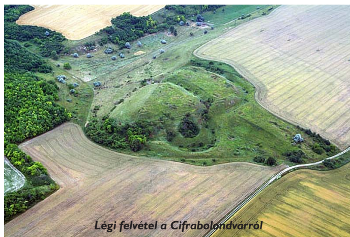
Légi felvétel a Cifrabolondvárról

A honfoglalás előtt is lakták ezt a vidéket. Az ásatások tanúsítják, hogy már 8000 évvel ezelőtt is éltek itt emberek. Számátalan településnyomra bukkantak a régészek a neolitikus kortól kezdődően. Korai bronzkori lakott helyek, temetőik nyomára bukkantak a Sárvíz nyugati oldalán, Hatvanpuszta déli határában, Őrspusztánál, a Videoton gyárnál, a két vasút között, valamint a Sárszent-