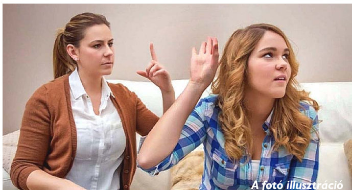
A fotó illusztráció

És jönnek a csábítások, s ha nincsen elég önbizalma, hogy ellenálljon, kisiklik az élete. Lehet, hogy fiatalon, lehet hogy később. A lejtőn nem lehet megállni.