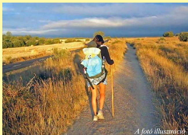
A fotó illusztráció

A Sárbogárdi Nyugdíjas Rendőr Egyesület tagjai nevében: Streng Ferenc ny. á. r. alezr.