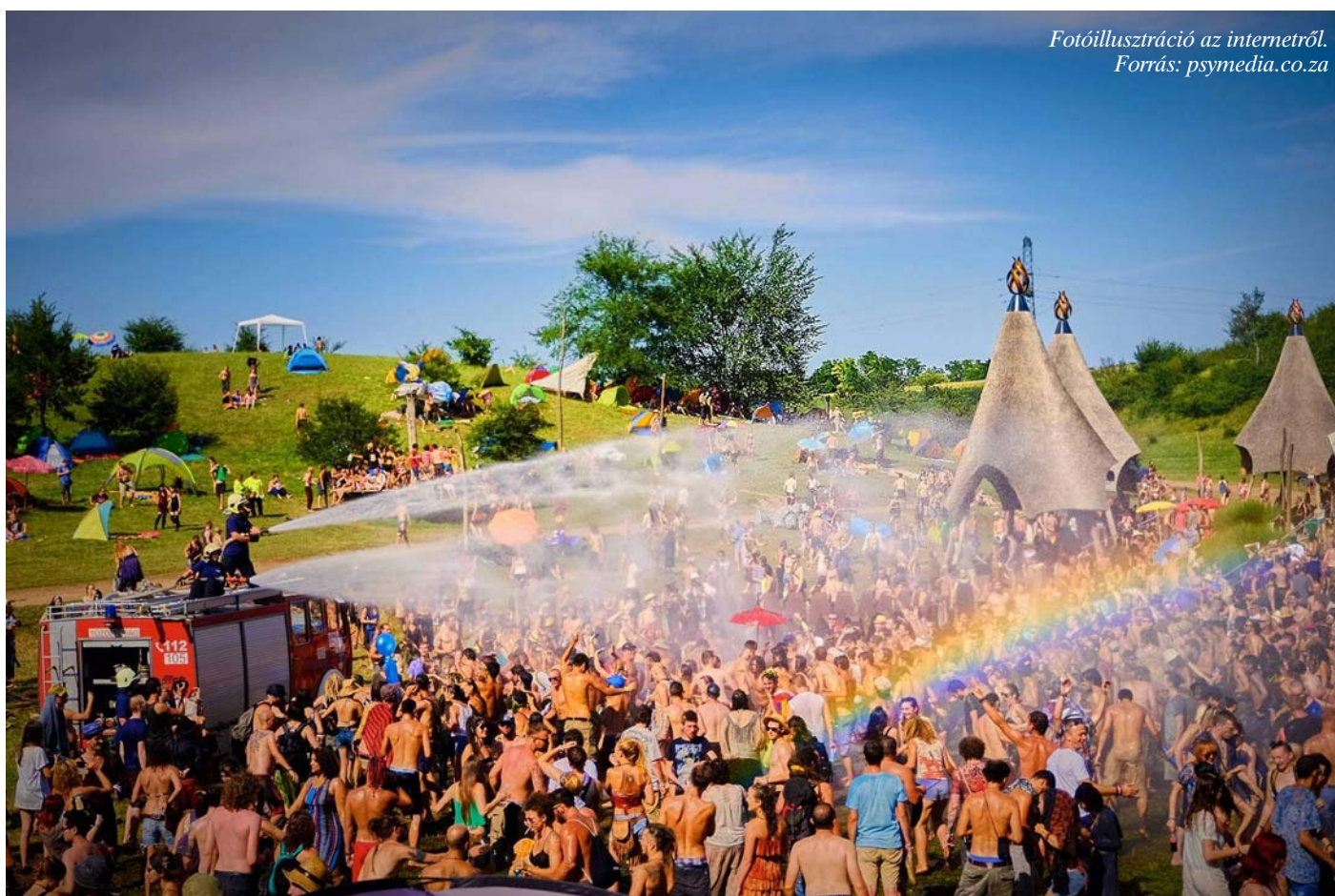
Fotóillusztráció az internetről. Forrás: psymedia.co.za

A Fejér Megyei Rendőr-főkapitányság Sajtószolgálatától, valamint a Fejér megyei katasztrófavédelmi szóvivőtől kértem tájékoztatást arról, hogy milyen tapasztalatokkal zárták az idei, nagy erőket igénybe vevő Ozora Fesztivált.