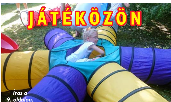
Írás a 9. oldalon.