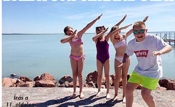
Írás a 11. oldalon.