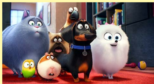
A kis kedvencek titkos élete