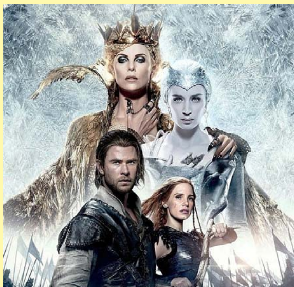
A Vadász és a Jégkirálynő