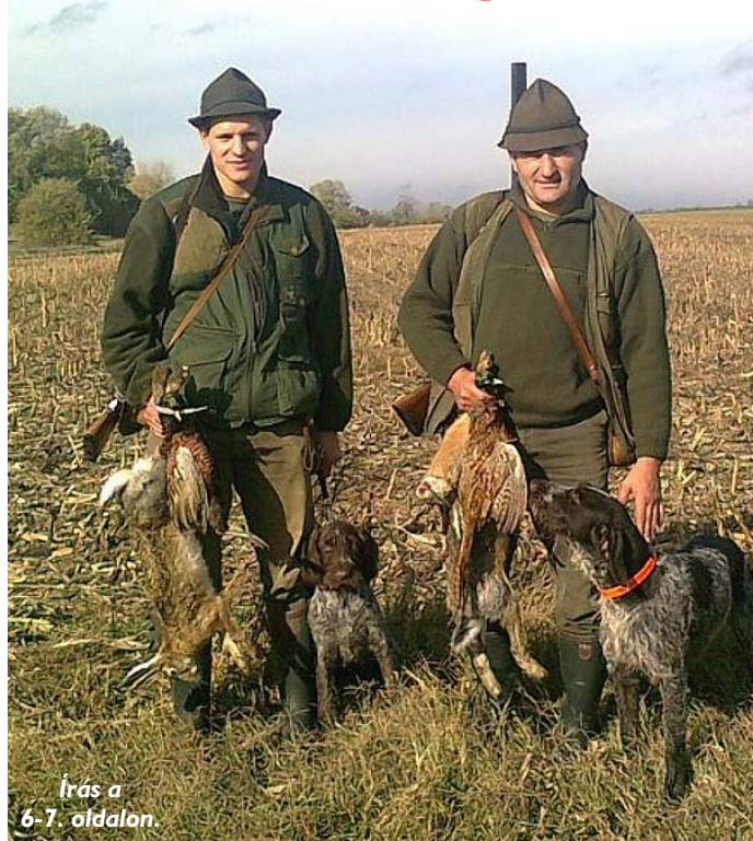
Írás a 6-7. oldalon.